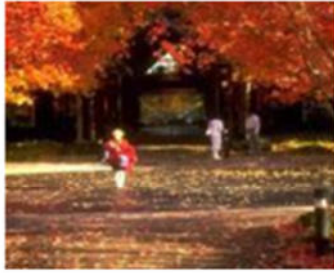
صورة (41) : قوة الألوان في إعطاء منظر مميز للمكان.

III-2-2-7 الطابع والمظهر الخارجي: وهي الصفة المميزة للشكل العام للحديقة إذ أن لكل حديقة ملامحها التي تتشكل بواسطة منشآتها التي تبرز شخصيتها المستقلة .