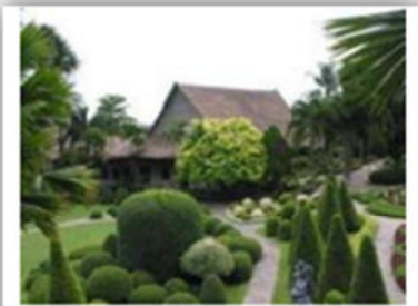
صورة (39) : الطابع المميز للحديقة يبرز شخصيتها.

III-2-2-5 السيادة والسيطرة: عند تصميم الحدائق يجب مراعاة إبراز بعض عناصر ومكونات تنسيق الموقع بهدف تبيين قيم متفردة بالموقع .