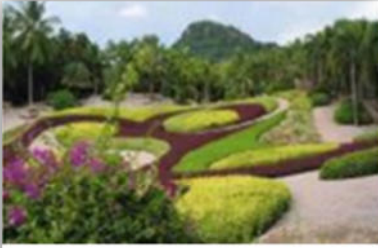
صورة (40) : تكرر العناصر مع تحقيق تتابع دون انقطاع.