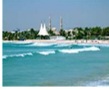
صورة ( 59 ) : حديقة الجميرا.