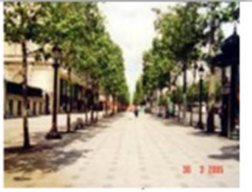
صورة (37) : تأكيد المحور من خلال صف الأشجار.