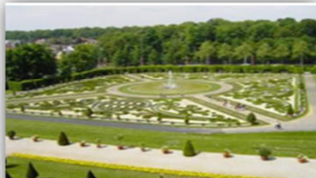
صورة (48): التناظر الشعاعي.