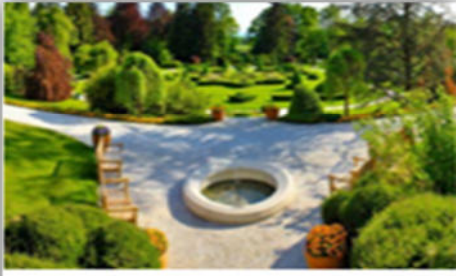
صورة (50): التصميم المختلط.