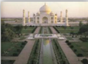
صورة (38) : سيادة العنصر الانشائي في المكان.

III-2-2-2 المقياس: إذ يجب أن يتحدد مقياس العناصر بما يتناسب مع الحيز المكاني ومستخدمي المنطقة.