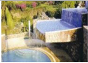
صورة (42) : التوافق بين العناصر النباتية و المائية

III-2-2-9 التتابع والاتساع: ويقصد به ترتيب عناصر الموقع بحيث ينظر إليها في متتابعة بصرية بهدف تحقيق نسق جمالي.