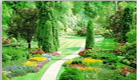
صورة (49): التصميم الطبيعي.

هو نظام يراعى فيه محاكاة الطبيعة قدر الإمكان؛ ويشترط فيه عدم استخدام الأشكال الهندسية ويناسب هذا النوع المساحات الكبيرة :