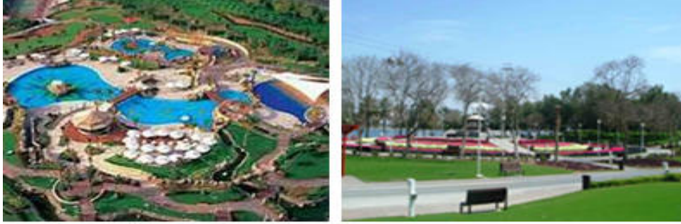
صورة ( 57 ) : حديقة خور دبي .