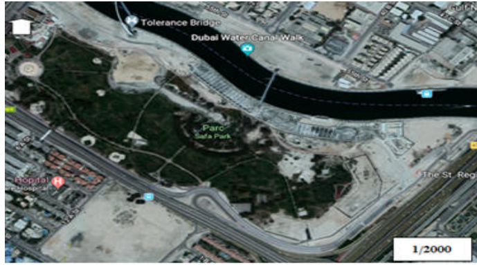
مخطط (04) : حديقة الصفا .

III-4-2-3 حديقة الصفا: وهي حديقة تحتوي على مروج خضراء واسعة، تغطي أكثر من 80 بالمائة من مساحتها الكلية.