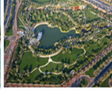
صورة (58) حديقة الصفا.