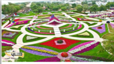
صورة (47): التناظر الدائري.