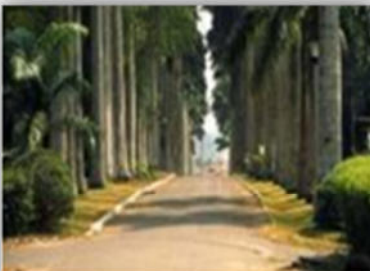
صورة (43) : تأثير الظل على المكان.

III-2-2-10 الألوان ودرجة توافقها: يجب عمل دراسة متأنية لألوان النباتات وأنواع وأسطح عناصر تصميم الموقع المختلفة حتى تتناسب مع بعضها فمثلا أن كان هناك مجموعتان من الأشجار مختلفتان في الألوان يجب الربط بينهما بمجموعة ثالثة ويجب أن تكون ألوانها متوافقة مع المجموعتين ويكون لديها درجات مختلفة من الخضرة؛ كذلك ألوان المنشآت المبنية تلعب دورا مهما في التكوين اللوني للحديقة لذلك يجب وضعها في الاعتبار عند عملية التصميم.