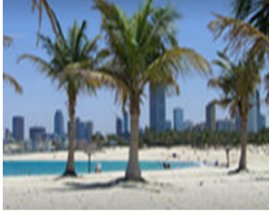
صورة ( 60 ) حديقة الممزر.