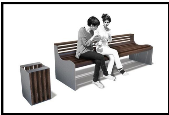
صورة 42: مقاعد عمومية

خلق محيط جيد في الفضاءات الجماعية ونذكر منها: