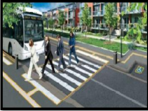
صورة 47: ممرات الراجلين