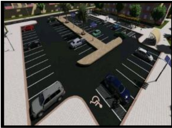
صورة 49: موقف سيارات

*بمحاذاة الأروقة والمراكز التجارية وعند مداخل الأحياء.