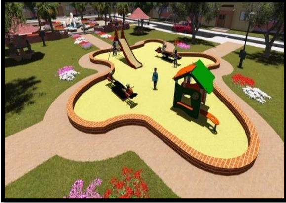
صورة 41: أماكن لعب الأطفال

❖ أماكن اللعب: بسبب انعدام الأماكن المخصصة للعب ارتأينا تطبيق جملة من الحلول أهمها: