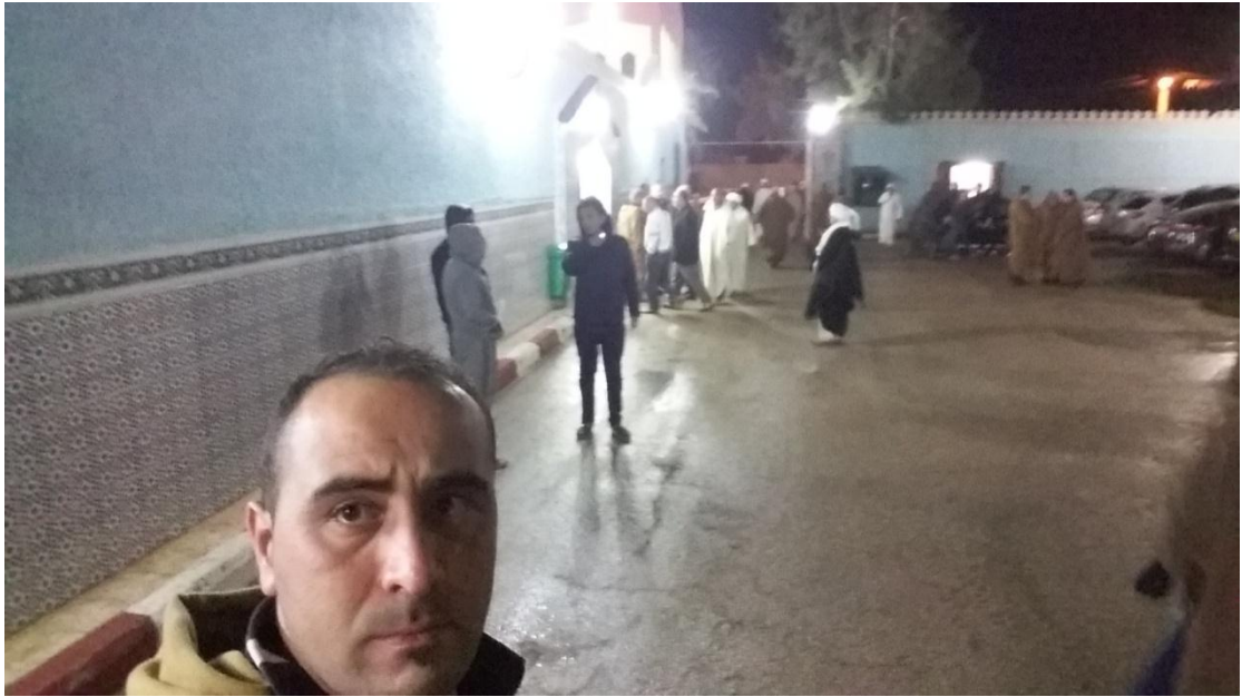
4/4 نهاية الحفل و مغادرة الزوار