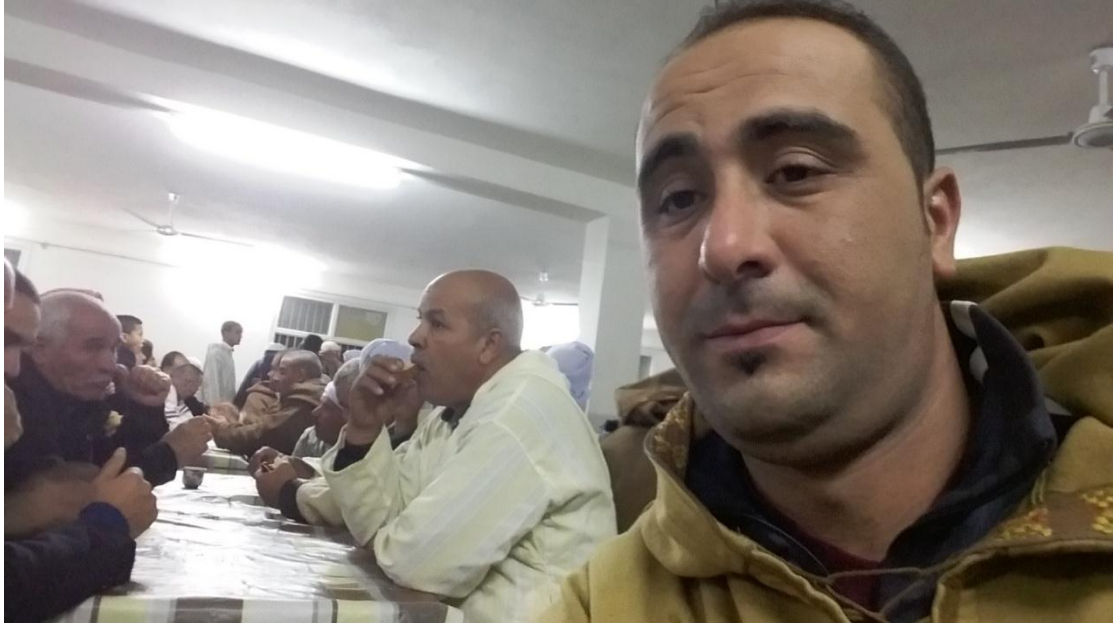
2/4 رفقة الاخباري و المحتفلون