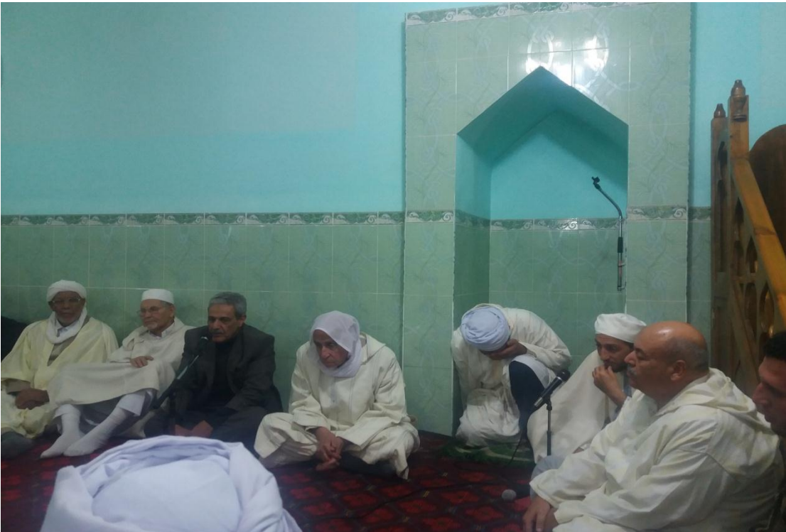
2/3 كلمة العياشي دعوة