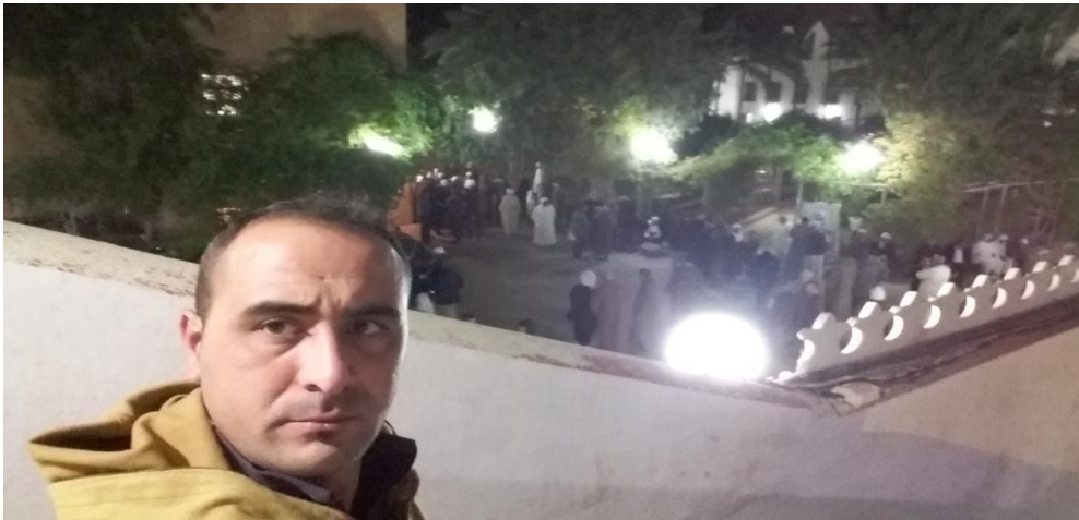
الصورة(7) تجمع الزوار داخل الزاوية في انتظار وليمة العشاء.