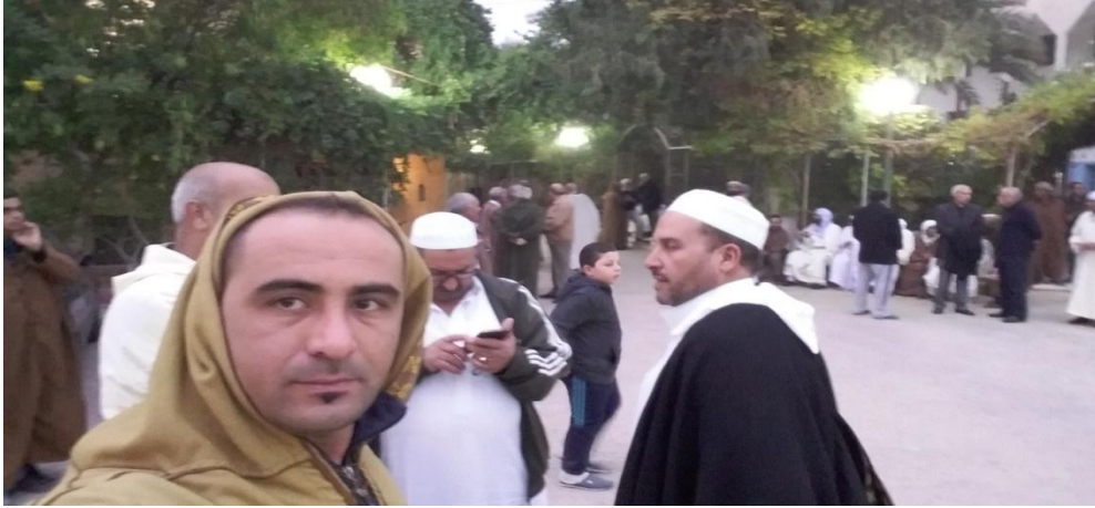
الصورة(6): مجموع من الزوار في أنتظار الدخول للعشاء

بعد صلاة العصر وحتى العشاء تبدأ وليمة المولد، مباشرة بعد صلاة العصر يبدأ استقبال الزوار امام باحة دار الضيافة بمنزل شيخ الزاوية عبد القادر عثماني، يجتمع الكثير منهم و يصطف في افواج ، يبدأ ادخال الوافدين عبر دفعات ، الاحدة تلو الاخرى يصل عدد كل مجموعة حوال 70 فرد ، يدخلون فوج بعد فوج، تتراوح مدة كل فوج حوالي 15د.