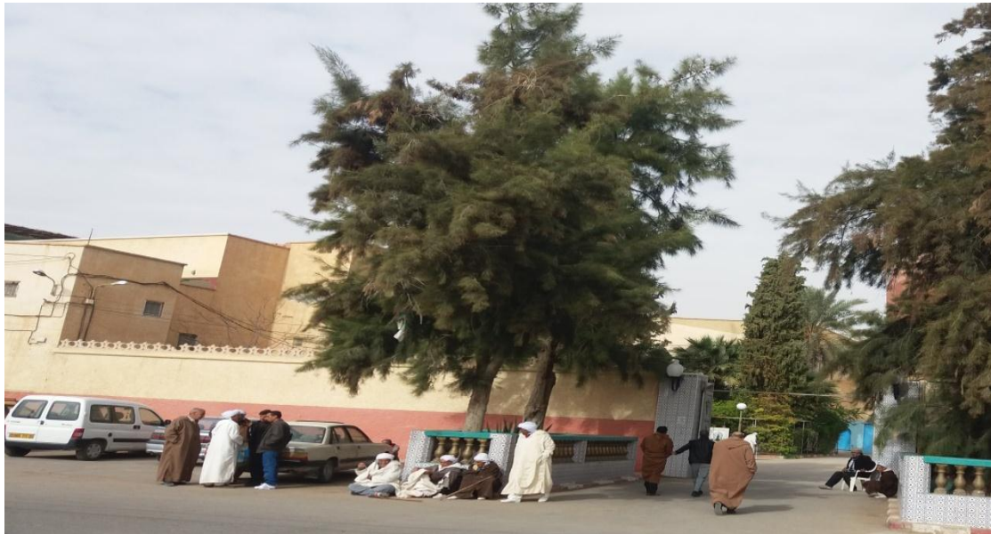
الصورة(4):اقبال الزوار للزاوية و الدخول من البوابة الرئيسية

و هو كذلك من يبين الطريق للنساء الوافدات و هو الذي ينادي على النساء في حال ما احتاج لهم ازواجهم ويشغل واسطة بين المجالين يخدم اكثر جانب النساء عندما يطلبون مساعدة في مختلف الشؤون، بالإضافة الى حارس الزاوية في المدخل الاساسي و الذي ينظم حركة الدخول و الخروج من و الى الزاوية و يبين الطريق للوافدين من اصحاب السيارات الذين يجيؤون مع اسرهم و يدخلون الزاوية يمرون بالبهو حتى المكان المخصص للنساء ينزلونهم هناك ويخرجون من الزاوية الى موقف السيارات خارج الزاوية و على الطريق في الجانبين الذي في ساعات المساء من يوم الاحتفال يكون مملوء على الاخر ، و لذلك خصص الملعب المقابل للزاوية في هذه الايام موقف سيارات للزوار الوافدة للزاوية و في ليلة المولد يشهد حضور كثيف للزوار و السيارات التي تملئ محيط الزاوية فلا تكاد تجد مكان تترك فيه السيارة من كثرة الاقبال للزوار.