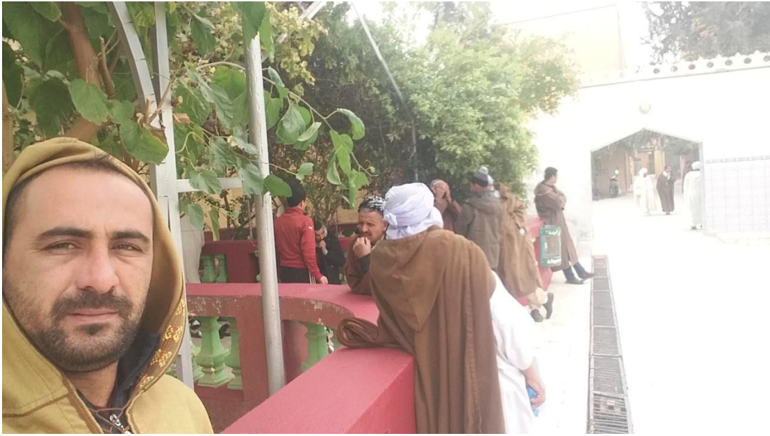
4/1- الباحث الى جنب زوار في مدخل المؤدي الى مسجد الزاوية