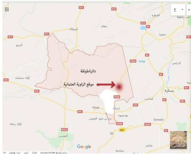
الشكل(3):موقع الزاوية العثمانية – طولقة

زاوية علي بن عمر في المدينة القديمة لطولقة على طريق المؤدي الى بلدية برج بن عزوز المكان المسمر " رحبة الجنازة " السوق القديم والعمارة العتيقة ، زاوية علي بن عمر ميدان الدراسة الفعلي ، هذه المؤسسة التي إختارها الباحث لإجراء الدراسة الميدانية لموضوع الاحتفالية و الزيارة التي ترتبط بالمجال الزماني الاتي ذكره و تحديده .