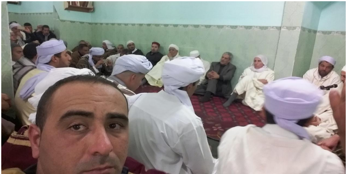
الصورة(10) الحضور و المشاركين في الحفل والطلبة

مستمسكون بجبلٍ غير منقسم** فاق النبيين في خلقٍ وفي خُلقٍ ولم يدانوه في علمٍ ولا كرم** وكلهم من رسول الله ملتمسٌ غرفاً من البحر أو رشفاً من الدير** وواقفون لديه عند حدهم من نقطة العلم أو من شكلة الحكم** فهو الذي تم معناه وصورته ثم اصطفاه حبيباً بارئاً النسم** منزّه عن شريكٍ في محاسنه فجوهر الحسن فيه غير منقسم** دع ما ادعته النصارى في نبيهم واحكم بما شئت مدحاً فيه واحتكم** وانسب إلى ذاته ما شئت من شرف وانسب إلى قدره ما شئت من عظم**... إلى آخر الابيات