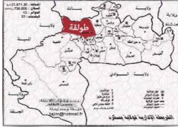
الشكل(2):خريطة طولقة-لولاية بسكرة

وفي هذا الموضوع تم تحديد جغرافية مؤسسة الزاوية العثمانية ، التي تنتمي الى دائرة طولقة التابعة الى ولاية بسكرة التي تبعد عن مركز الولاية بحوالي 38 كم .