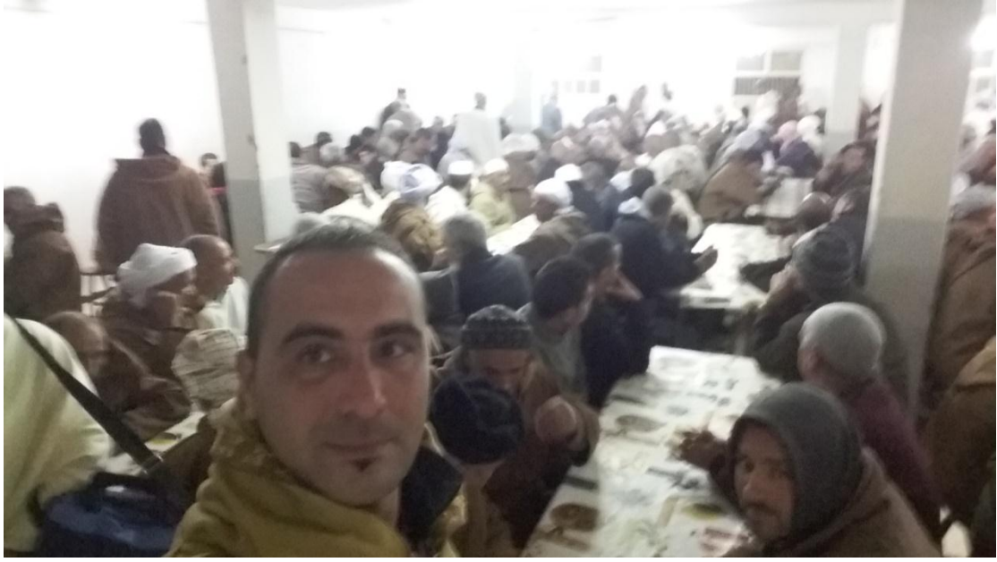
1/4 المحتفلون في المطعم للتحلية