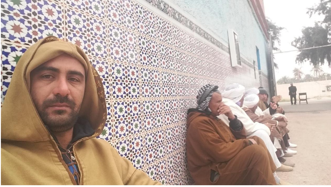
3/1-الباحث الى جنب بعض الزوار داخل الزاوية العثمانية.