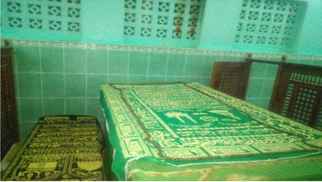
5/1-صورة لظريح مؤسس الزاوية علي بن عمر