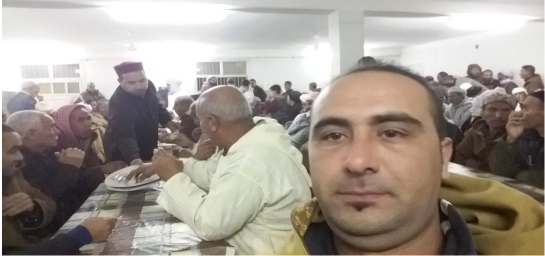
الصورة (13):التحلية مع نهاية الحفل