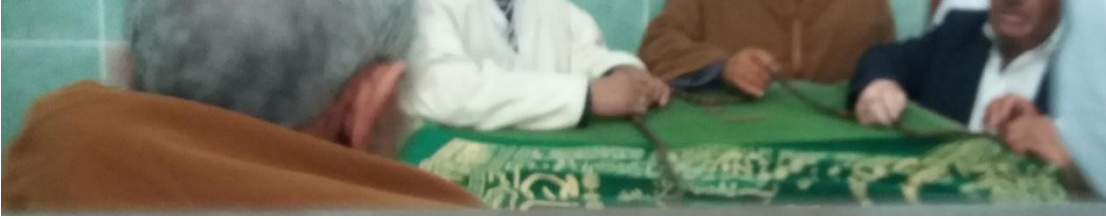
6/1-صور لزوار الضريح علي بن عمر