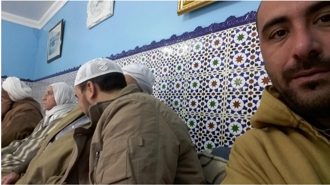
الصورة(2): شيخ الزاوية في استقبال الضيوف بمناسبة المولد.

المستقبلين لزوار الزاوية ، يستقبلون الوفود في دار الضيافة يرحبون بهم و يوفر لهم كل شروط الراحة، استقبال بهيج يغمر الحاضرين بفرحة اللقاء مع شيخ الزاوية الذي يرحب بالزوار و يطمئنهم بتوفير كل ما طاب لهم من ايوائهم الرجال مع ذويهم من النساء و الاطفال، و يبين لهم اماكن ايوائهم و مراقدهم، كما يضمن لهم الطعام و المبيت في احسن الظروف، قبل يوم الاحتفال الكبير وفي بداية الاستقبال للوفود حضرت مع مجموعة من المريدين و احباب شيخ الزاوية و ضيوفه من رواد الزوايا و العاميين في هذا المجال ، مع توافد الزوار توجهنا من بهو الزاوية الى القاعة الاستقبال التي مع شيخ الزاوية وهو يرحب بنا : اهلا و سهلا بكم جميعا و مرحبا كما يقول : 'اهلا بكم في زيارة النبي' ، انتم احباب النبي فأنتم في رحاب الرسول، مجددا الترحيب و تسهيل كل الظروف لضيوفه و ضيوف الزاوية و ضيوف النبي كما يقول دائما، بقينا معه مدة من الزمن قدم خلالها الطلبة لنا القهوة ، مرحبين بنا و سط بهجة من الزوار واستحسان اجواء الضيافة و فرحة بلقاء شيخ الزاوية و القاء فيما بينهم .