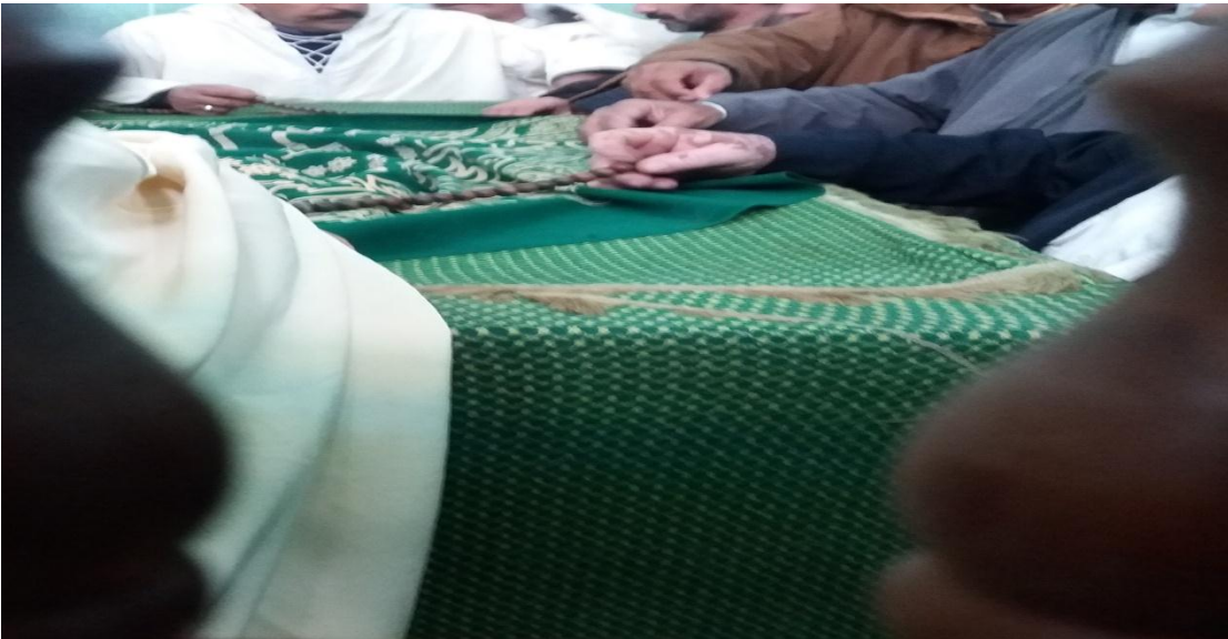
7/1- طقوس التسبيح داخل مقام علي بن عمر