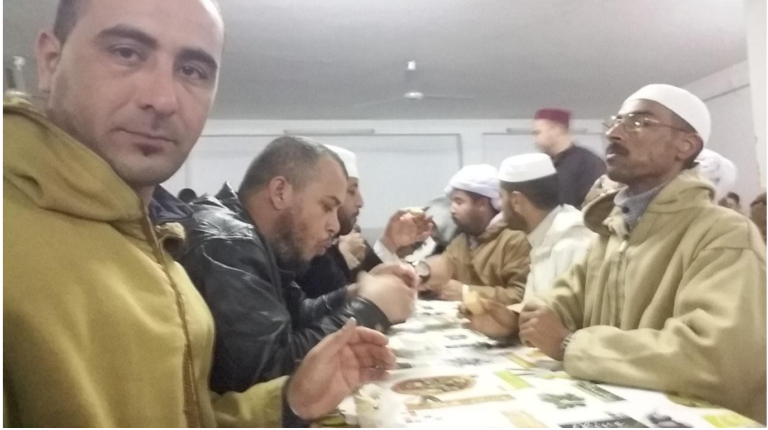
3/4 رفقة الاخباري و مجموعة من الطلبة