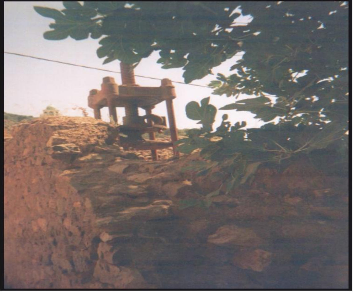
معصرة قديمة (ترمتين)

الملحق رقم 02: تبين معصرة تقليدية للزيتون في منطقة القبائل 2 .