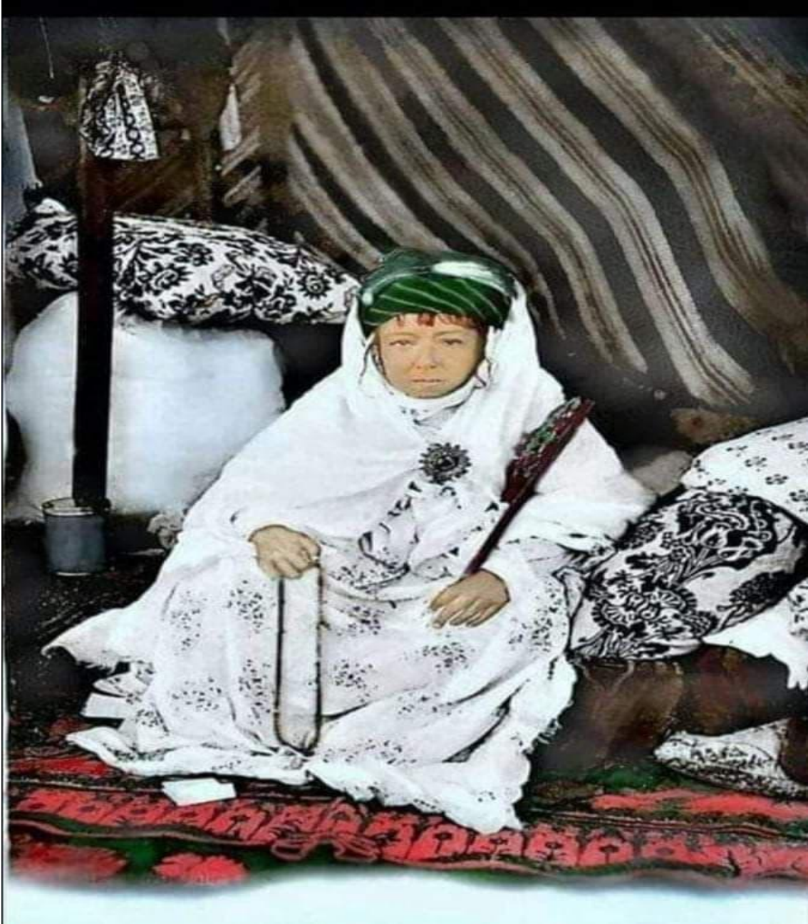
المرجع: منير القاسمي، المرجع السابق، ص 53.