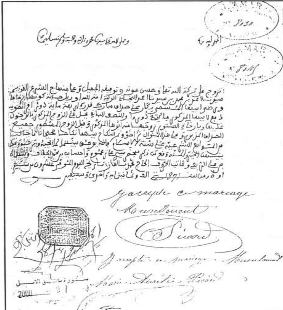
نسخة من عقد الزواج