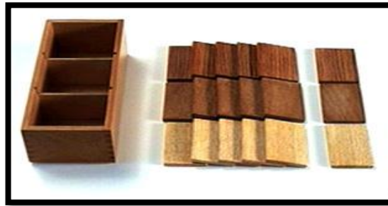
الشكل 12: ألواح الوزن .