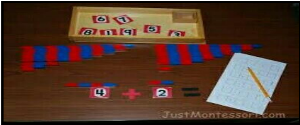
الشكل 15: عصيان العد.