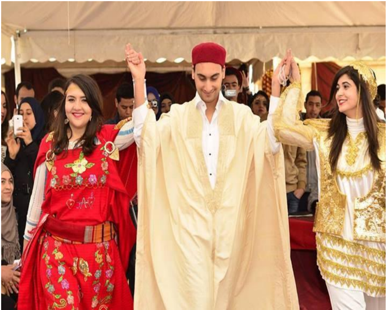
الزي التقليدي في تونس

لقد حافظت الكثير من البلاد التي عانت من الاستعمار والاحتلال مدة طويلة على تراثها من الزي التقليدي، ليس هذا فحسب بل مازال أهل تلك البلاد يرتدون الزي نفسه في هذه الأيام الحالية، من بين تلك البلاد هي المغرب وتونس والجزائر، حيث تُعدّ الملحفة لباساً مرتبباً بالمرأة الجزائرية، وهو قطعة قماش بيضاء خالية من التطريز تلفها المرأة على جسدها، بالإضافة إلى تغطيتها الرأس بقطعة قماش بيضاء كبيرة بحيث لا يظهر منها سوى عينيها، كما ارتبط الزي الأبيض بالديانة الإسلامية كرمز للإسلام والسلام.