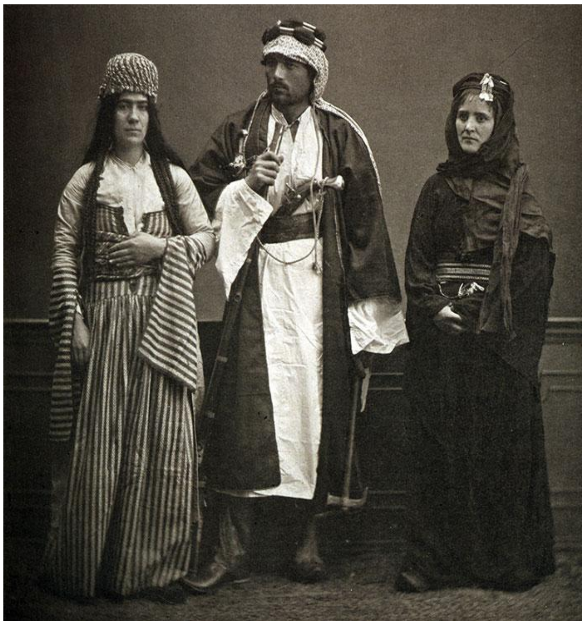
إحدى الأزياء التقليدية السورية