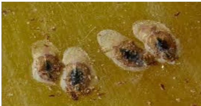
Figure 1 Parlatoria blanchardi (Anonyme,2022)

En Mauritanie, elle est signalée en 1949 dans l'Adrar, d'Atar à Toungad, Tergit, et Tagant. et dans le Sahara centrale : Fezzan, Hoggar, Tassili (Balachowsky, 1953). Elle est signalée à Timimoun en 1912 ; Colomb Bechar en 1920 ; Bousaada en 1925 ; El Golia en 1926 ; Tidikelt en 1928 ; Saoura en 1930, et dans toutes les oasis de Biskra à Ouargla par Balachowsky de 1925 à 1928( Nadji , 2011 )