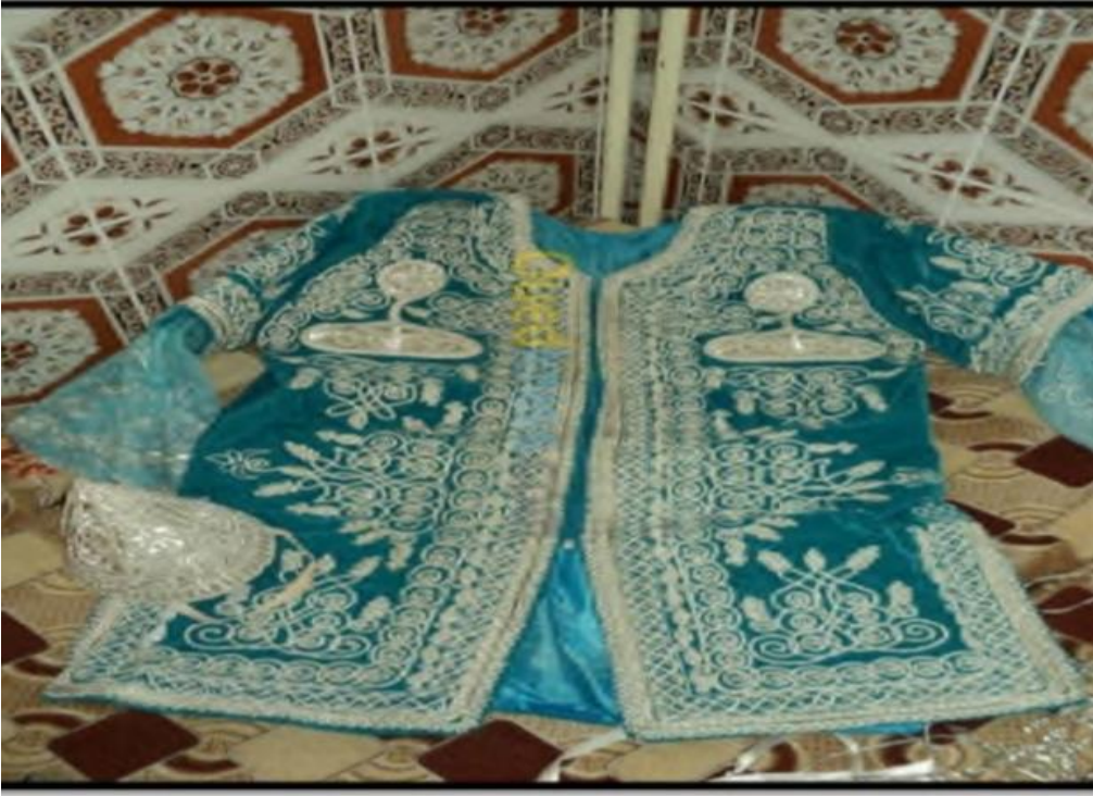
الملحق رقم 7: القرفطان التلمساني