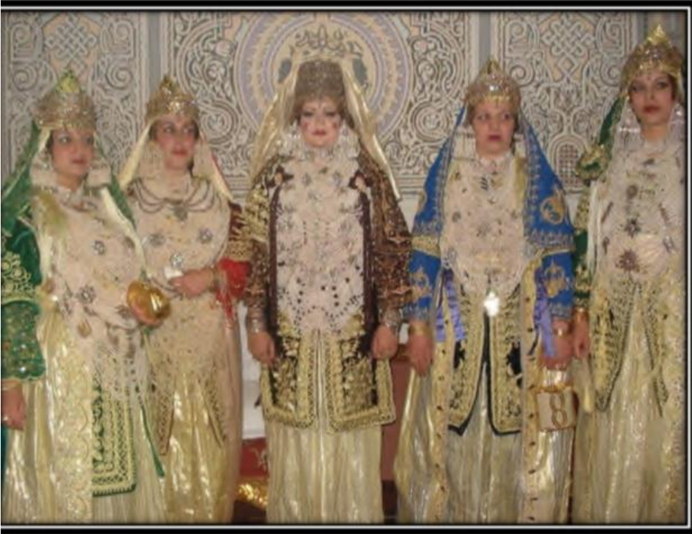
المصدر: لبلق أسماء، التحولات الثقافية والرمزية لمراسم الزواج في الاسرة التلمسانية