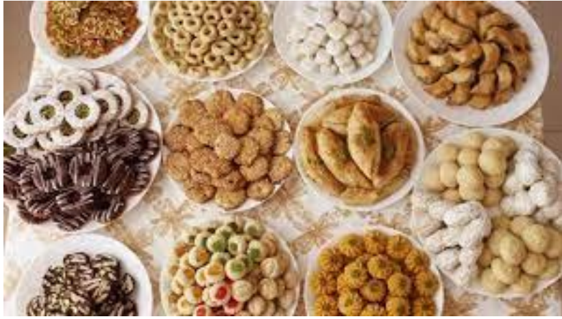
حلوى العيد أنواع و اشكال جديدة