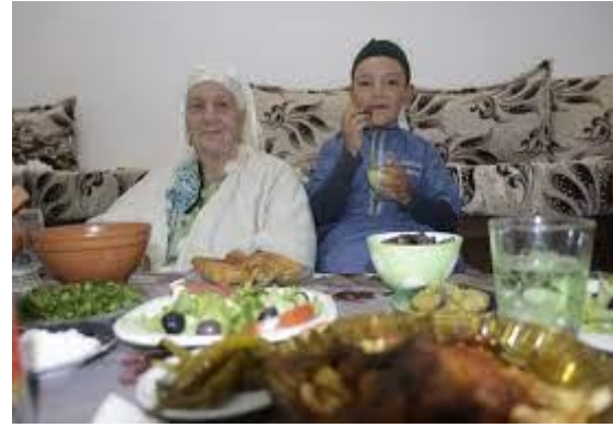
مظاهر الاحتفال بصيام الأطفال أول مرة