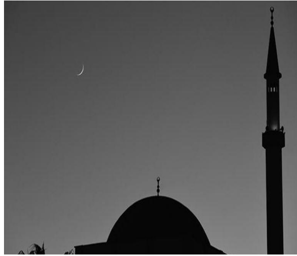
ليلة الشك 29 رمضان