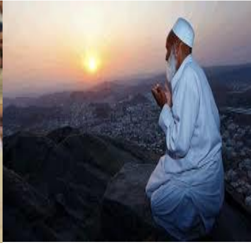
مظاهر ليلة 27 من رمضان