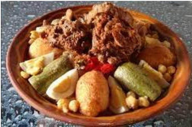
طبق الشخشوخة البسكورية