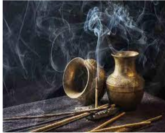
تعطير البيوت بالبخور