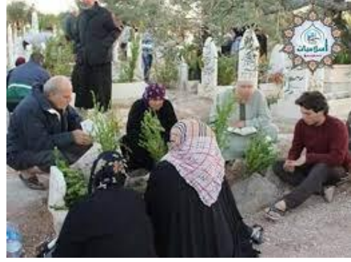
زيارة القبور في العيد