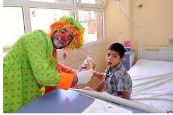
زيارة المرضى في العيد