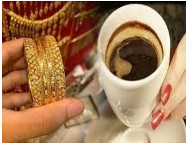
عادة حق الملح