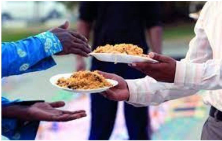
طاولة حلويات العيد