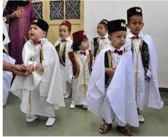
مظاهر ختان الأطفال