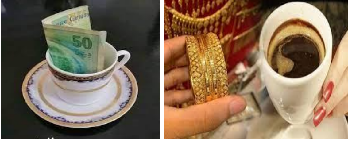
الشكل رقم 12 : يوضح عادة حق الملح

وعرفاناً منهم بجهودهنّ طيلة الشهر الفضيل". كما أنّ عادة "حقّ الملح" صبيحة يوم العيد "يعيد الاعتبار إلى حقّ العشرة ويعزّز روابط العلاقات بعد رمضان هذه العادة نقلها الأندلسيون للجزائر كما هي معروفة أيضاً بتداولها في البلدان المغاربية كتونس والمغرب وليبيا بتسميات متقاربة، مشيرة إلى أن بعض العائلات الجزائرية لازالت تحافظ عليها على هذه العادة، باعتبارها موروثاً شعبياً من الزمن الماضي، ويثري الموروثات الثقافية في البلاد.