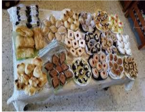
طاولة حلويات العيد