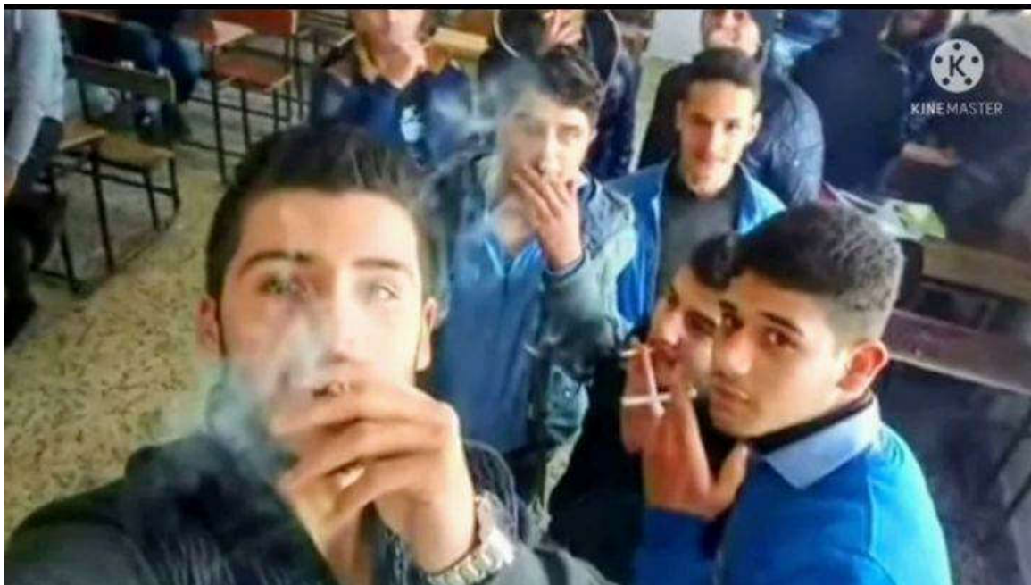
صورة توضح إنحراف التلاميذ داخل الصف الثانوي

وسبب تأثر التلاميذ بالمؤثر يعود إلى أن المؤثرين يقومون بعرض تفاصيل حياتهم المثيرة و المسلية، و كيف يقضون روتينهم اليومي ، إضافة إلى طريقة تجديد حياتهم ، و هذا ما يسعى المراهق لتحقيقه ، حيث يرى أن حياة المؤثرين مثالية خالية من المشاكل و بهذا يكتسب سلوكيات المؤثر ليكون مثله.