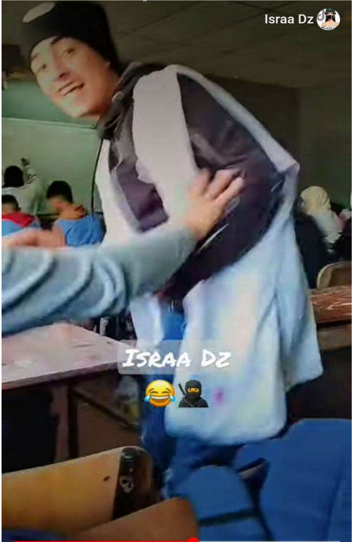
صورة توضح رقص تلميذ أثناء إنغماس الأستاذ في كتابة الدرس مأخوذة من أحد الثانويات الجزائرية