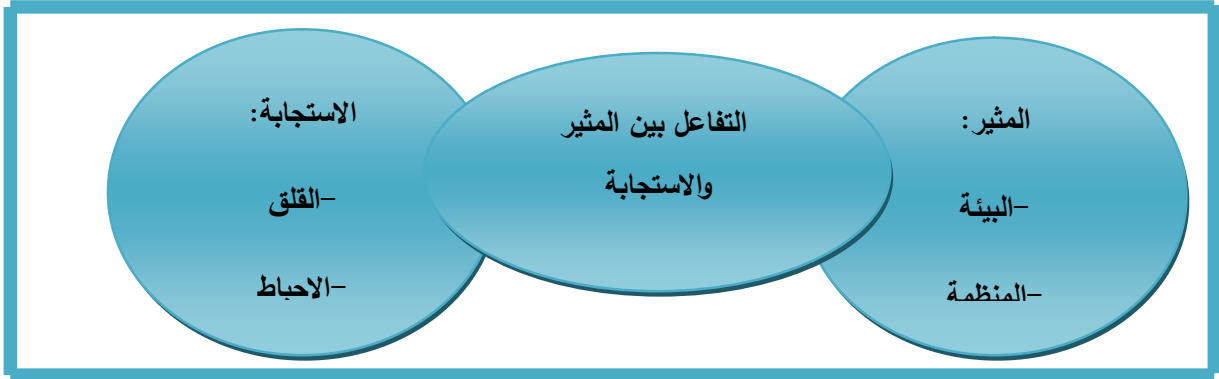
الشكل (2) يوضح عناصر الضغوط المهنية (عبد المجيد 2005، ص 306)