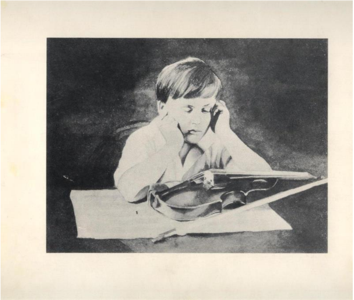
اللوحة الاولى 1

الملحق رقم : 02 اللوحات المستعملة في اختبار تفهم الموضوع: