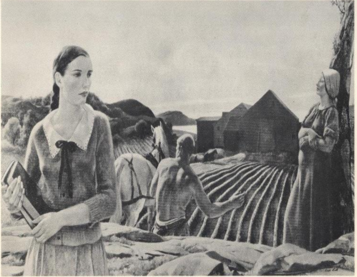
اللوحة الثانية 2