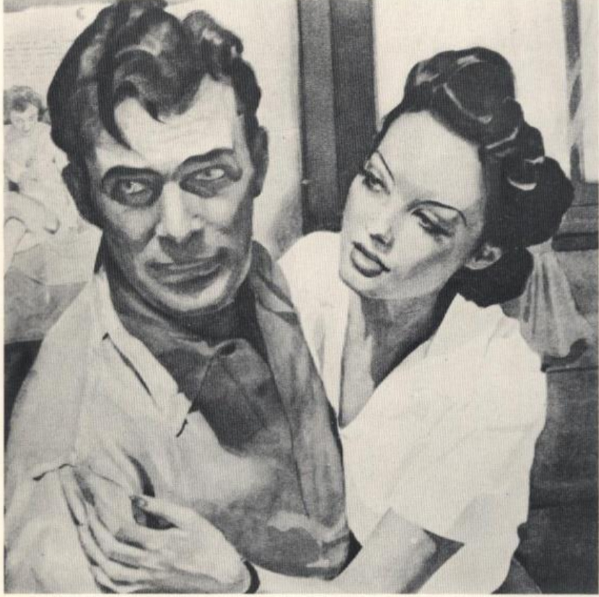
اللوحة الرابعة 4