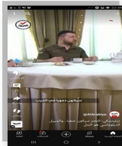
الصورة 9: لقطة من الفيديو رقم 2