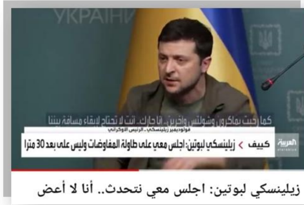
الصورة 8: لقطة من الفيديو رقم 1.