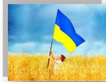
الصورة 6: علم أوكرانيا