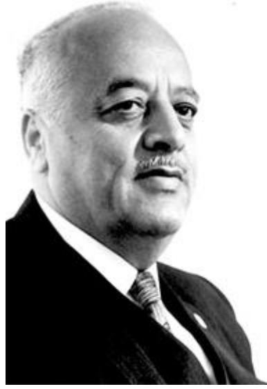
أحمد الشقيري أول رئيس لمنظمة التحرير الفلسطينية .