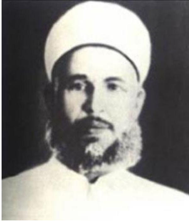
الشهيد الشيخ عز الدين القسام قائد منظمة القسام الجهادية ومؤسسها