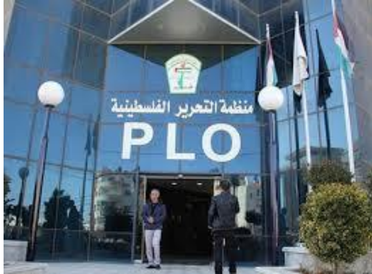
منظمة التحرير الفلسطينية

متاحة في صفحة الأنترنت على الرابط الآتي: