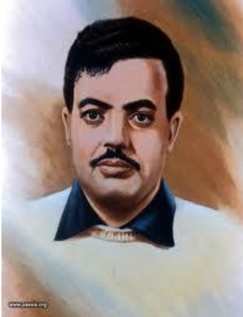
الشهيد كمال عدوان (أبو رامي)، أبرز مؤسسي حركة فتح