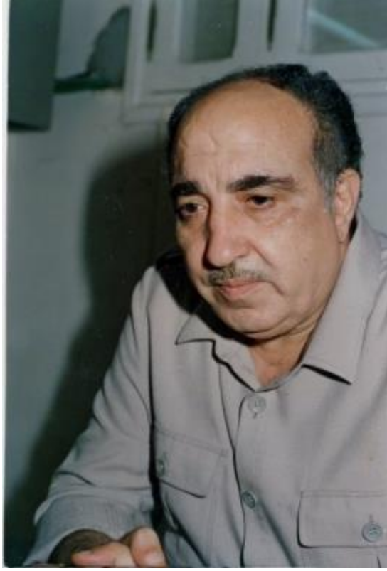
الشهيد صلاح خلف (أبو اياد)، أبرز مؤسسي حركة فتح

متاحة في صفحة الأنترنت على الرابط الآتي: