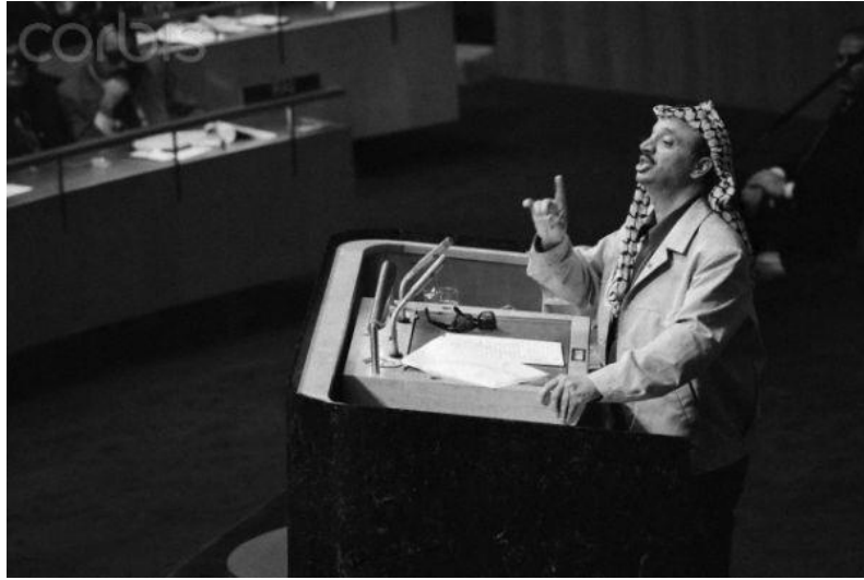
ياسر عرفات في هيئة الأمم المتحدة عام 1974

محسن محمد صالح، القضية الفلسطينية خلفياتها التاريخية وتطوراتها المعاصرة، ص 88.