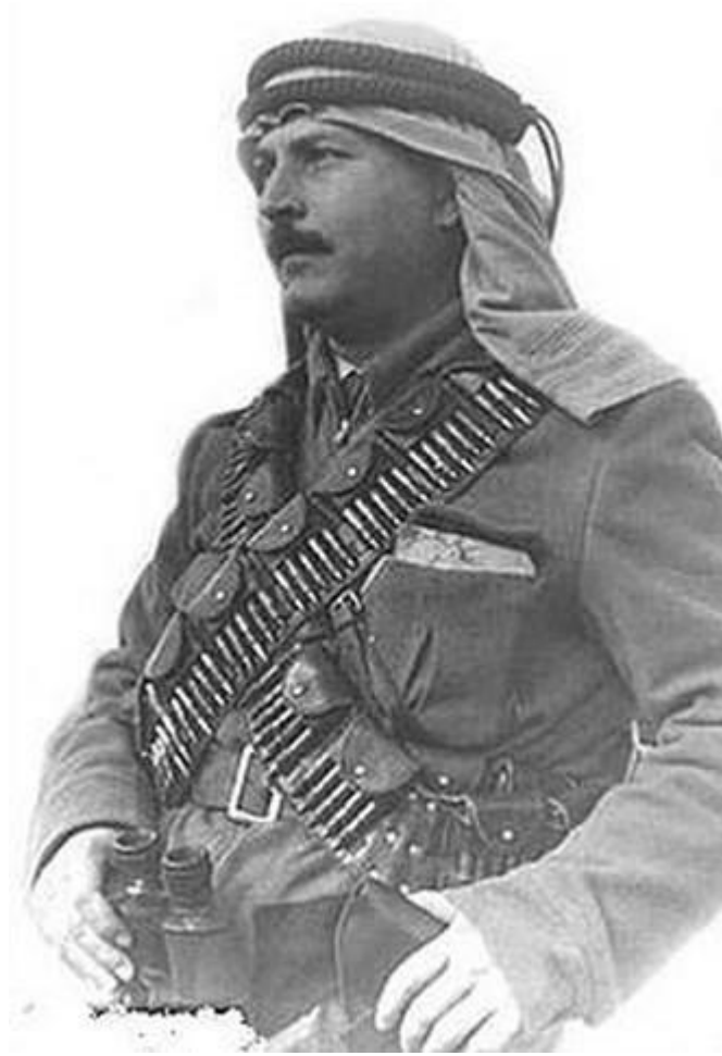
الشهيد عبد القادر الحسيني قائد منظمة أبطال المقدس