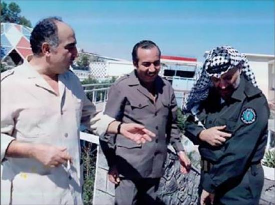
صورة لأبرز مؤسسي حركة فتح: من اليمين ياسر عرفات، خليل الوزير، صلاح خلف

متاحة في صفحة الأنترنت على الرابط الآتي: