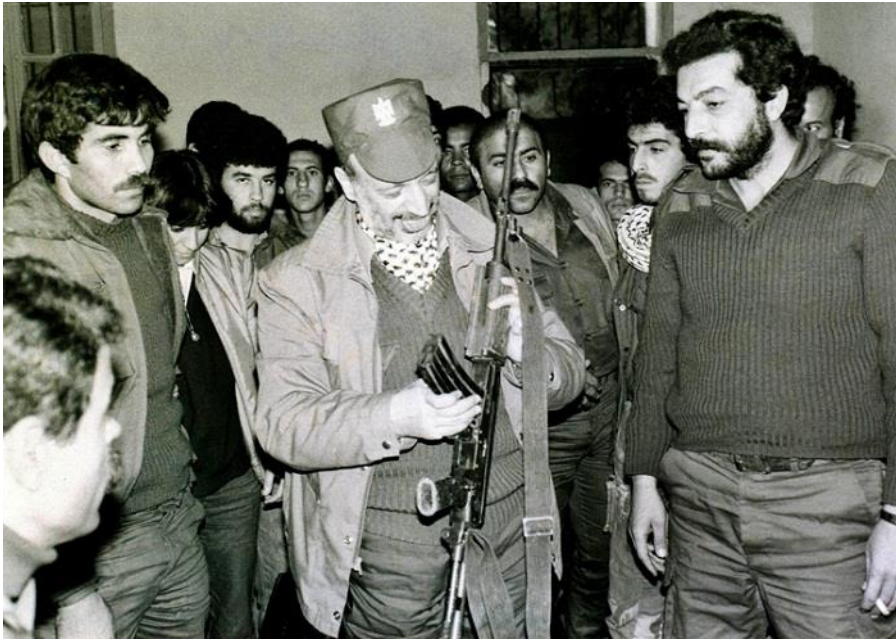
الشهيد ياسر عرفات (أبو عمار)، أبرز مؤسسي حركة فتح

محسن محمد صالح، القضية الفلسطينية خلفياتها التاريخية وتطوراتها المعاصرة، المرجع السابق، ص 89.