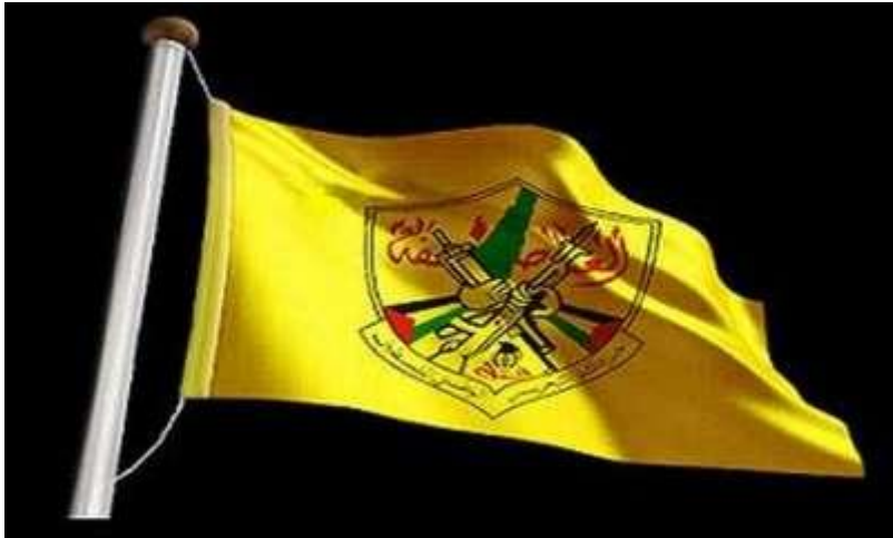
شعار حركة التحرير الوطني الفلسطيني -فتح-

متاحة في صفحة الأنترنت، على الرابط الآتي: