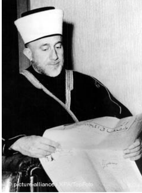
الحاج أمين الحسيني رئيس اللجنة العربية العليا

محسن محمد صالح، القضية الفلسطينية خلفياتها التاريخية وتطوراتها المعاصرة، المرجع السابق، ص 74.