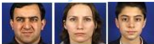
Fig. 1. Quelques exemples d'images de visages de la base de données XM2VTS

La figure 1 représente quelques exemples d'images de visages de la base de données XM2VTS.