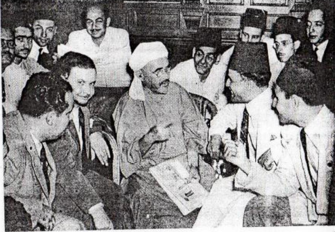
الأمير عبد الكريم الخطابي اثر وصوله الى القاهرة مع زعماء المغرب العربي في مكتب المغرب العربي الى يسار الامير الرئيس الحبيب بوهقيبة ( تونس ) السيد الشاذلي المكي ( الجزائر ) والى يمينه الاستاذ علال الفاسي ( المغرب الاقصى ) والاستاذ عبد الحالق الطريس . ( النقطة الشمالية بالمغرب الاقصى ) ( 1947 )

الملحق رقم 06: صورة توضح وصول الأمير عبد الكريم الخطابي إلى مصر رفقة المناضلين المغاربة ومن بينهم علال الفاسي 1 .