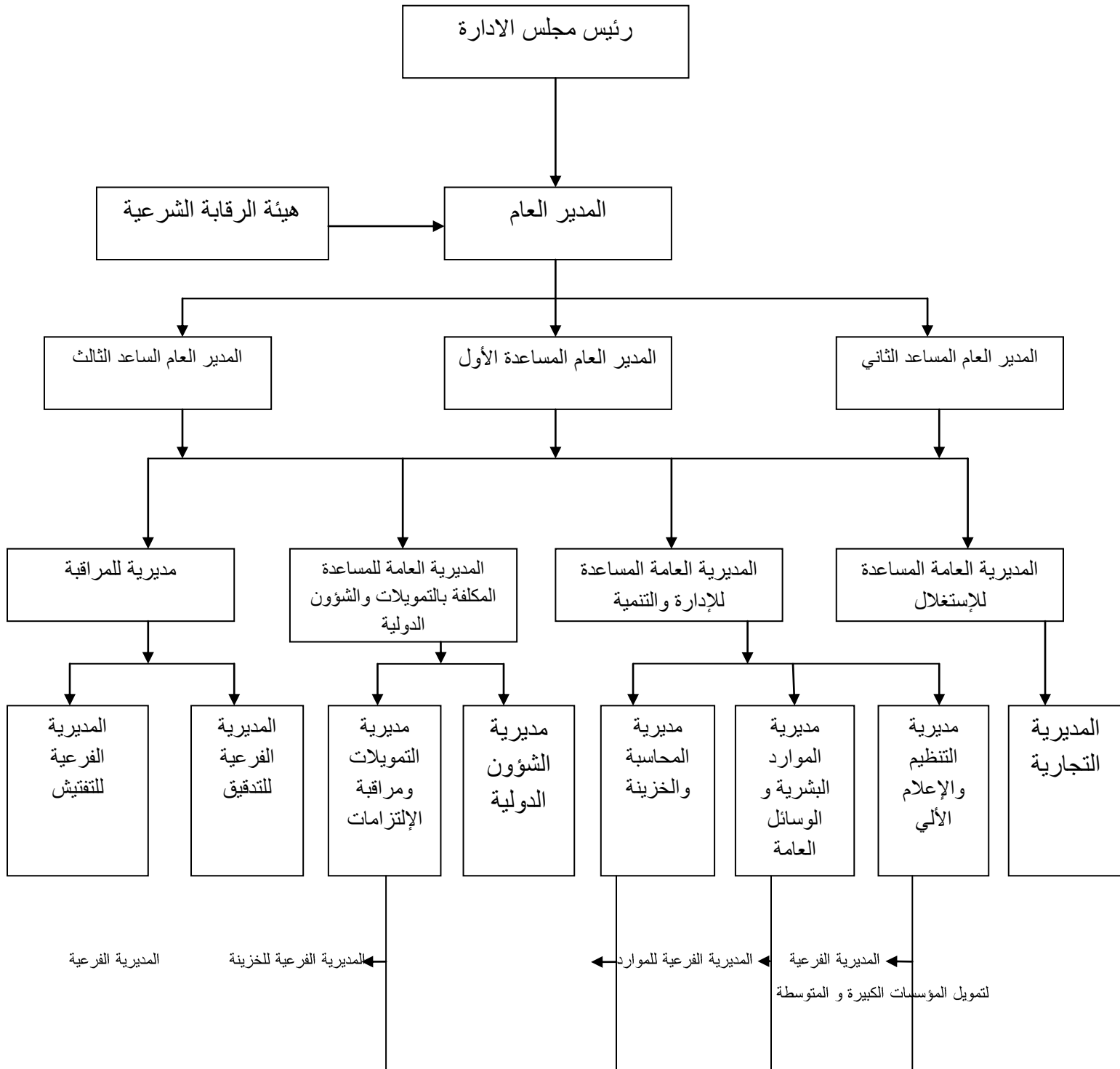
الشكل رقم 01: الهيكل التنظيمي لبنك البركة الجزائري