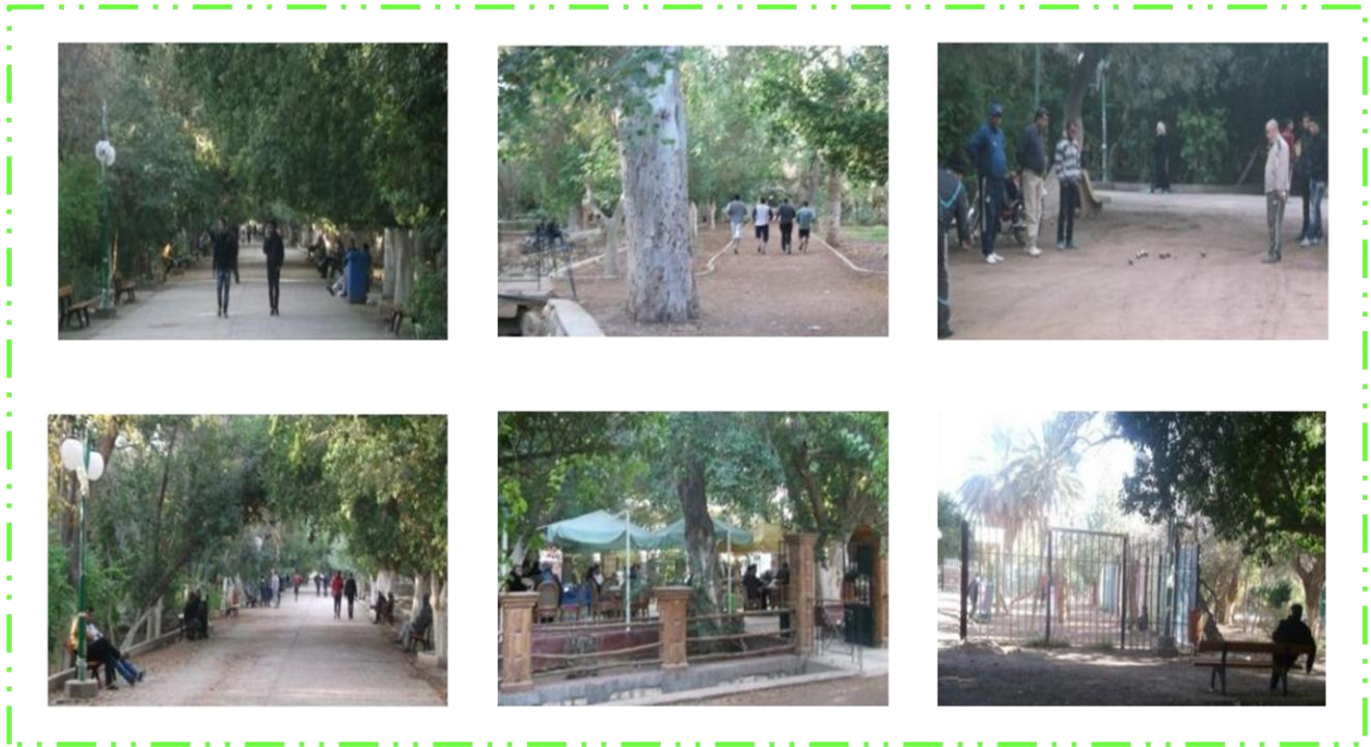
Figure 49 : la variété d'image des pratiques d'activités au sien du jardin 05 juillet