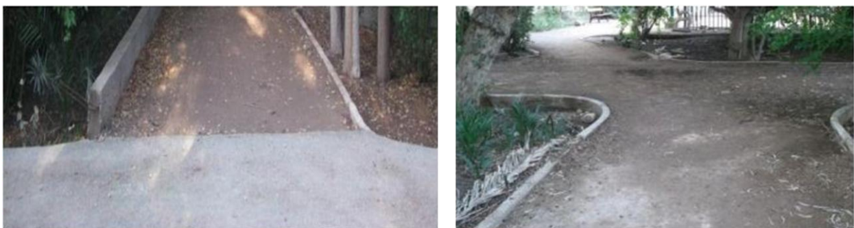
Figure 44 : type de traitement de sol dans le jardin 05juillet

2-5- Le sol : le plancher du jardin en terre, reflète le sol naturel, et l'intégration des éléments naturels, à l'exception de l'axe principale du jardin qui est traité en béton (figure 44).