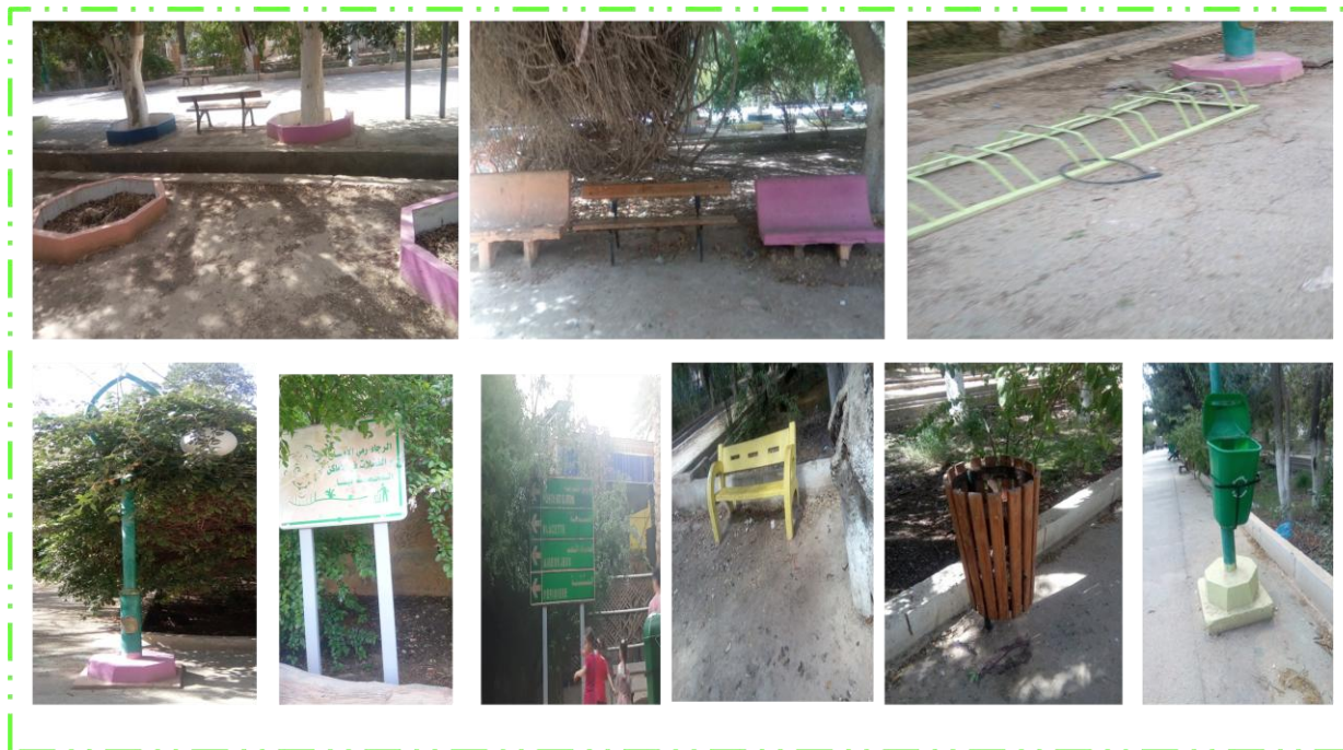
Figure 48 : les différents types du mobilier urbain existant dans le jardin 05 juillet (source : Auteure, 2018)

2-8- Le mobilier urbain : on constate l'existence d'un mobilier urbain (les bancs, les candélabres, panneaux d'affichage,...), (figure 47) ancien et nouveau au sein du jardin. Ce dernier a été récemment doté d'un nouveau mobilier suivant un projet de réhabilitation du jardin tout en gardant le mobilier déjà existant après rénovation.