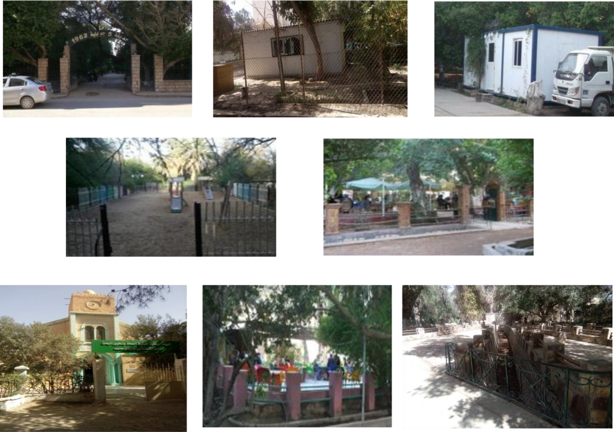
Figure 43 : Les différents équipements du jardin 05juillet

2-5- Le sol : le plancher du jardin en terre, reflète le sol naturel, et l'intégration des éléments naturels, à l'exception de l'axe principale du jardin qui est traité en béton (figure 44).