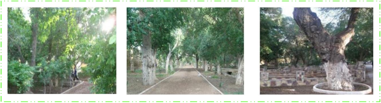
Figure 45 : l'état actuel de la couverture végétale dans le jardin 05 juillet

2-7- L'élément eau : les séguias sont réparties sur toute la surface du jardin, qui possède un forage récent, ces séguias issues d'une retenue d'eau, irriguaient les différents quartiers de la ville pendant l'époque postcoloniale. Actuellement le jardin souffre d'un manque terrible d'eau (figure 46 et figure 47).