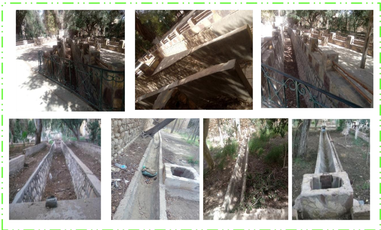
Figure 46 : l'état actuel des séguias dans le jardin 05 juillet

2-7- L'élément eau : les séguias sont réparties sur toute la surface du jardin, qui possède un forage récent, ces séguias issues d'une retenue d'eau, irriguaient les différents quartiers de la ville pendant l'époque postcoloniale. Actuellement le jardin souffre d'un manque terrible d'eau (figure 46 et figure 47).