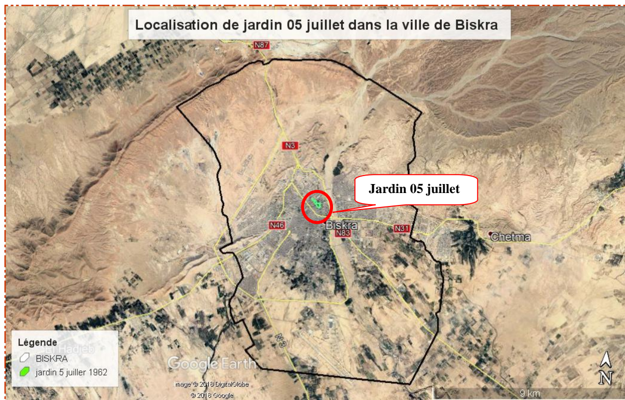
Figure 41 : Localisation du jardin 05 juillet dans la ville de Biskra

Il a été créé par les colons français après la bataille de Zaatcha en 1849 et la colonisation totale de l'oasis de Biskra. Le jardin se situe en plein centre-ville dans le quartier du damier colonial, limité au nord par une caserne qui demeure fonctionnelle jusqu'à ce jour, il englobe l'ancienne église catholique, transformée en centre culturel islamique puis depuis juillet 2017 en fondation nationale pour la promotion de la santé et le développement de la recherche.