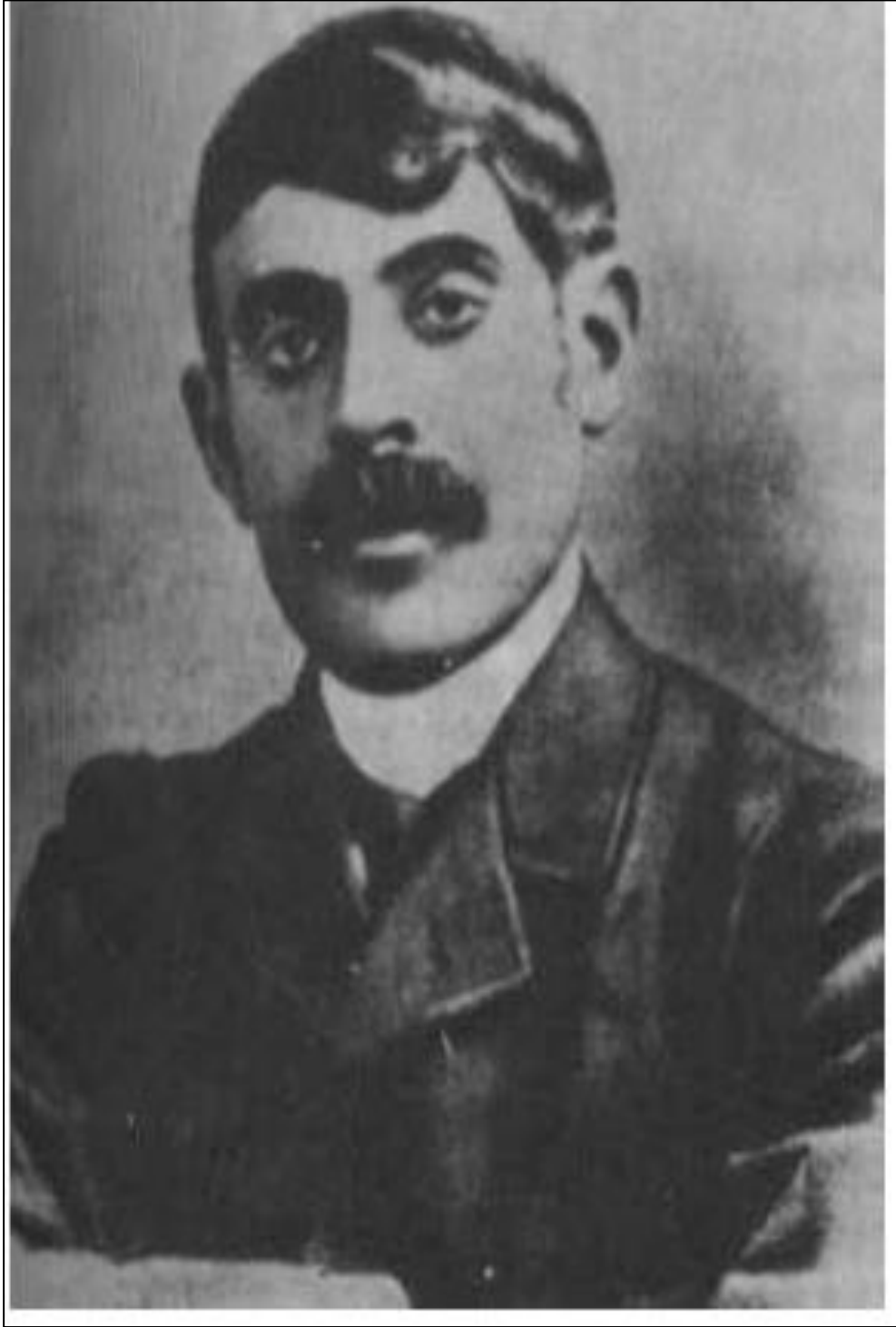
الملحق رقم (06): صورة قاسم أمين