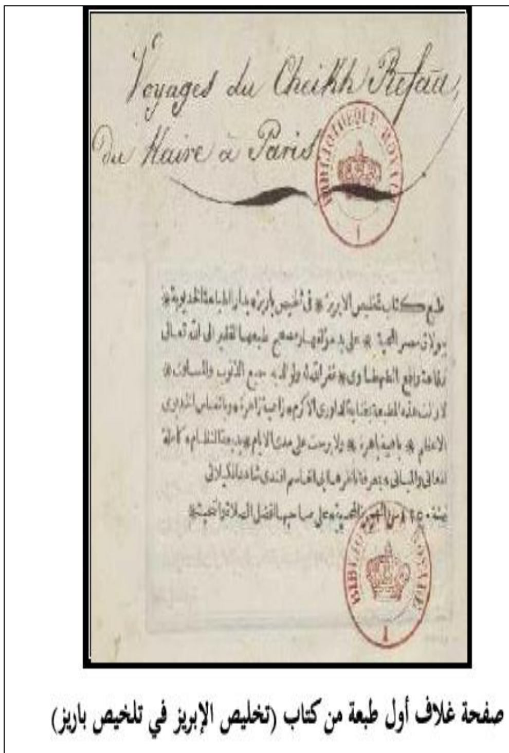
صفحة غلاف أول طبعة من كتاب (تخليص الإبريز في تلخيص باريز)

الملحق رقم (02): صورة غلاف أول طبعة من كتاب رفاة رافع الطهطاوي (تخليص الإبريز في تلخيص باريز)