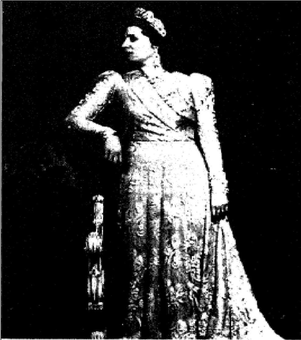
الملكة نازلي في الثوب الملكي الرسمي . . صورة التقطت لها في عهد إسماعيل فاروق وبعد رحيل زوجها الملك فؤاد .