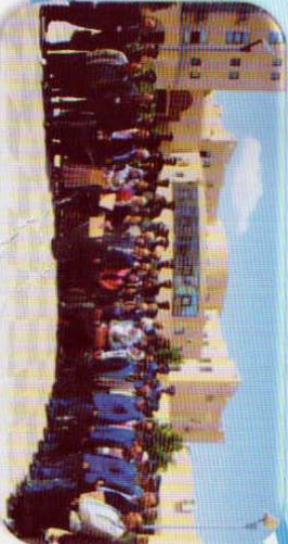
المشاركة في فعاليات اليوم العالمي لحقوق المستأجر المنظم من قبل مديرية التجارة يوم 15 مارس 2017 بدار الثقافة ، وفعاليات الملتقى الدولي 17 بجامعة محمد خضطر يومي 10 و 11 أبريل 2017 بقرن الحامية القانونية للمستأجر في ظل التحولات الاقتصادية الراهنة.