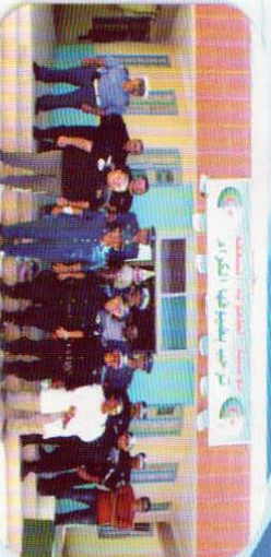
الاحتفال باليوم العالمي واليوم الأفريقي للطفل تم تنظيمهما للأطفال يومي 01 و 16 جوان 2016 بدار الثقافة بإشراف مختلف الفاعلين والجمعيات والهيئات ، زيارة مؤسسة الطفولة المسعفة والأطفال المرضى بالمكثف بالمستشفى خلال اليوم الأول لعيد الفطر.