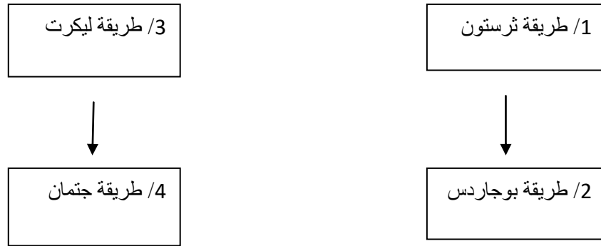
الشكل (03) يوضح طرق قياس الاتجاه

يلاحظ في هذا المقياس أنه يصلح لقياس الاتجاهات التي يمكن معها وضع عبارات يمكن تدرجها .(سهير ، 2001 ، ص108).