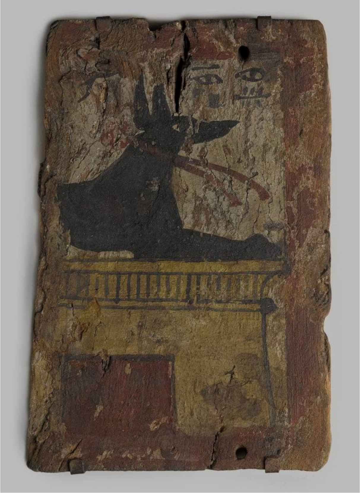
قطعة تابوت عليها صورة انوبيس 1550_ 712 قبل الميلاد، متحف بروكلين