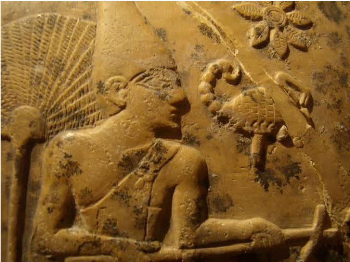
جدارية الفرعون العقرب ابوشادوف سيسبي فو