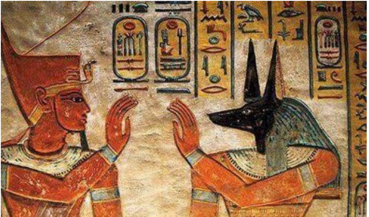
ست اله الشر