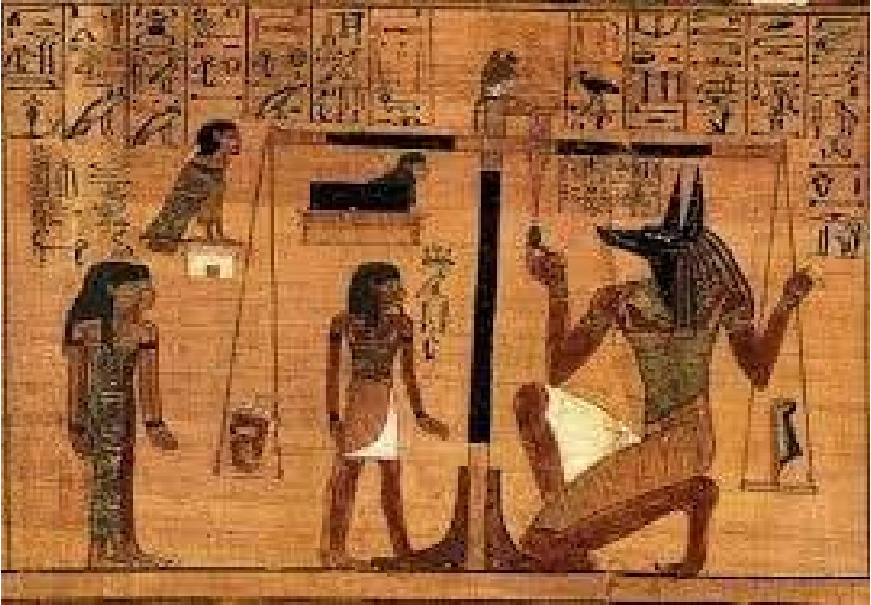
انوبيس اله الموت يقوم بطقوس الموت امام اوزوريس