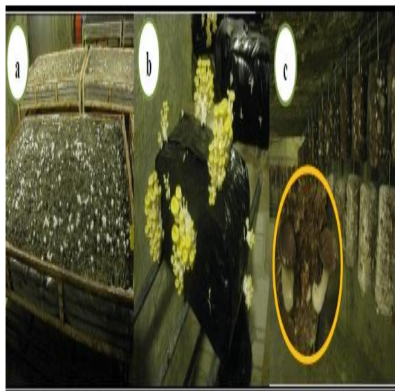
Figure 4: quelque exemple de culture des champignons saprophytes comestibles par excellence (Anonyme 4 ).(a) : champignons de paris ( Agaricus bisporus ). (B): Pleurotus ostreatus . (c): shiltaké ( lentinula edodes ). (Mesfek, 2014)

technologies qui sont bien établies et maîtrisées dans de nombreux pays. (Blandeau, 2012)