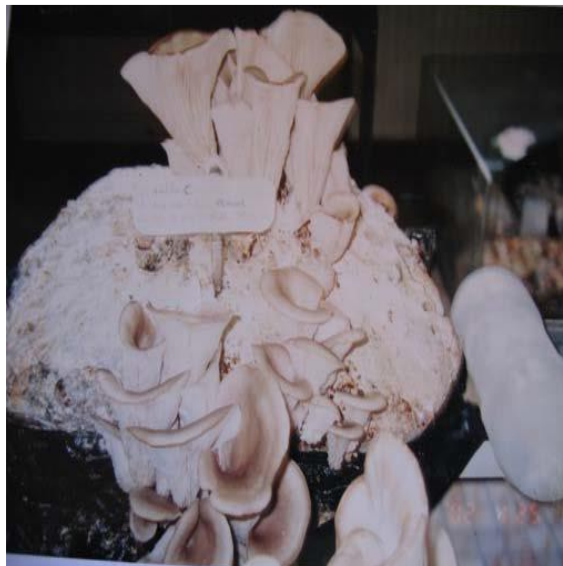
Figure 6: Fructification de la souche POL (Souche C= POL) (Benamar et al. ., 2013)