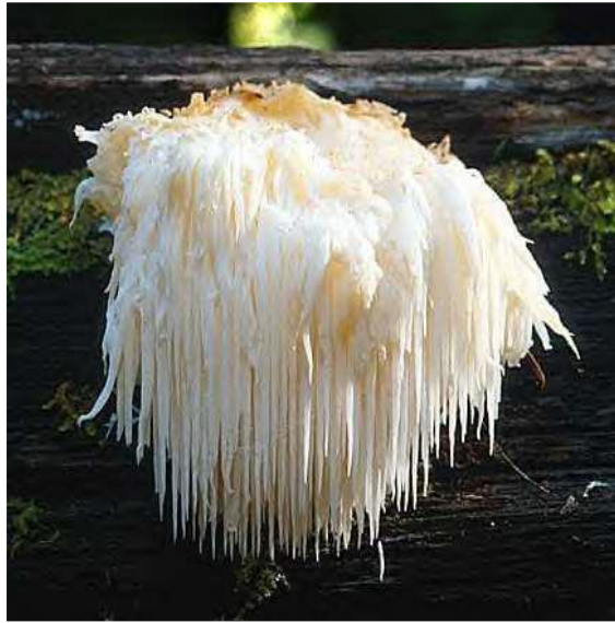
Figure 2: L'hydne hérisson ( Hericium ernace ) (Demers, 2015)