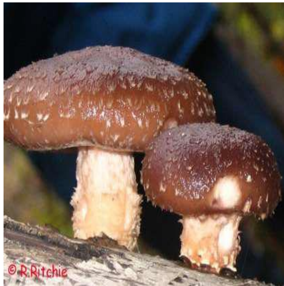
Figure 1: Shiitake ( Lentinus edode ) (Demers, 2015)