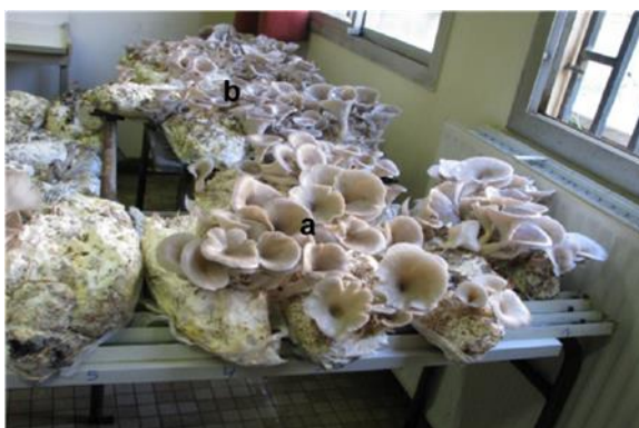
Figure 9: Fructification de LPO (a) et de la CPO (b) (Benamar et al. , 2013)

En ce qui concerne les fructifications ( figure 8 et 9 ), les fructifications se sont formées de façon continue sur les deux substrats Déchets de moulin à d'olive de substrat et Déchets de moulin à d'olive de substrat sèche. L'ajout de paille de blé (10%) et de carbonate de calcium (2%) a permis d'améliorer significativement les rendements des deux souches. Dans le cas de la SOMW seul, il n'y a pas de différences significatives entre les souches pour la plupart des paramètres, mais en moyenne, les Pleurotus Ostreatus commerciale sont tendance à produire des pourcentages plus élevés de petites fructifications que les Pleurotus Ostreatus locales . Dans l'eau de SOMW avec 10% de (WS=wheat straw, la paille de blé) et 2% de Ca CO 3 (SOMWS=Substrat olive mill waste, Déchets de moulin à d'olive de substrat sèche), les rendements de la souche locale de Pleurotus Ostreatus étaient significativement plus élevés (P =0.05) que ceux de la souche commerciale P535.