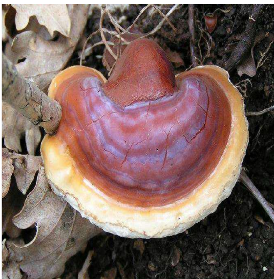
Figure 3: Reishi ( Ganoderma lucidum ) (Demers, 2015)