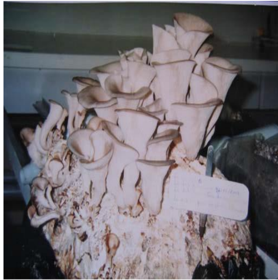
Figure 5: Croissance moyenne de la CPO sur le SOMW après 3 et 6 jours d'incubations (Benamar et al. , 2013)