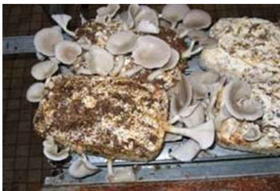
Figure 8: Fructification de CPO sur SOMW (Benamar et al. , 2013)

convient de noter que le taux moyen de croissance mycélienne entre le jour 0 et le jour 3 était de 0.5-0.6cm 2 /jour, alors qu'il était 1.05cm 2 /jour entre le jour 3 et 6 cela montre que le SOMW pasteurisé est un bon substrat pour Pleurotus Ostreatus .