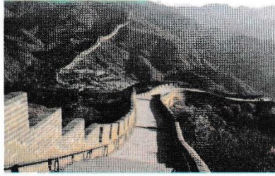
▲ سور الصين العظيم

السّياحة نافذة نطلّ من خلالها على عادات الشّعوب وتقاليدها الرّاسخة، وهي وسيلة تقارب وتعاون بينها، ومن خلال أدب الرّحلات نعيش في ضيافة الشّعوب مستمتعين بسحر موروثها وتنوّع طبيعتها.