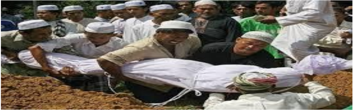
الدفن قبل الكورونا.