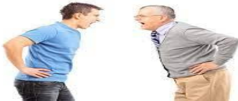
صورة تجسد صراع الأجيال.