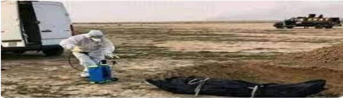
الدفن بعد الكورونا.