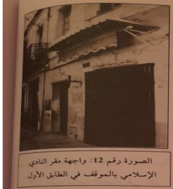
الملحق رقم (05): مقر النادي الإسلامي