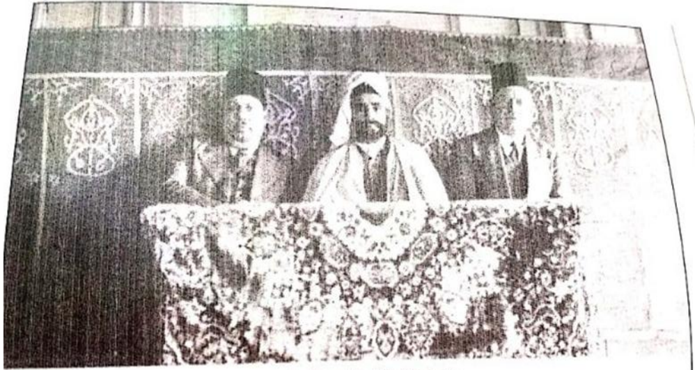
منصة الخطابة بنادي الترقى