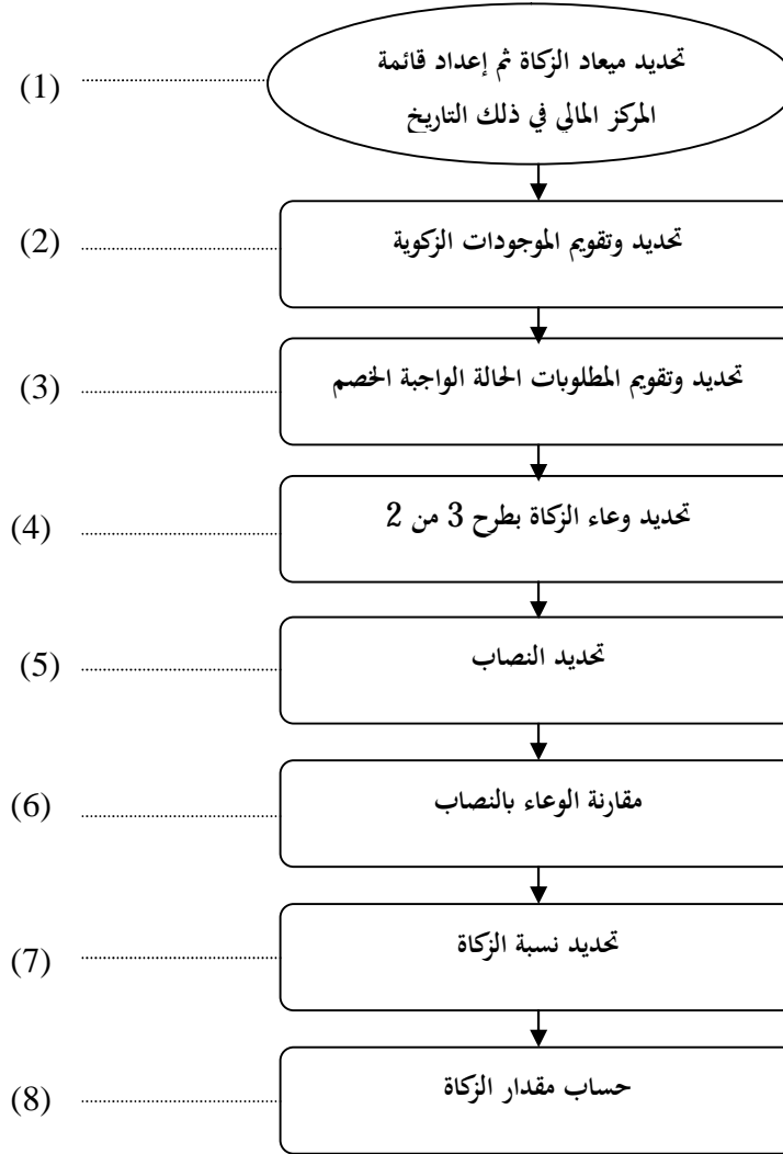
الشكل رقم (01) خطوات تحديد وعاء زكاة الشركات وحساب الزكاة المستحقة

المصدر: عبد الستار أبوغدة، حسين شحاتة، دليل المحاسبين للزكاة، مكتبة التقوى، القاهرة، 2007، ص:23.