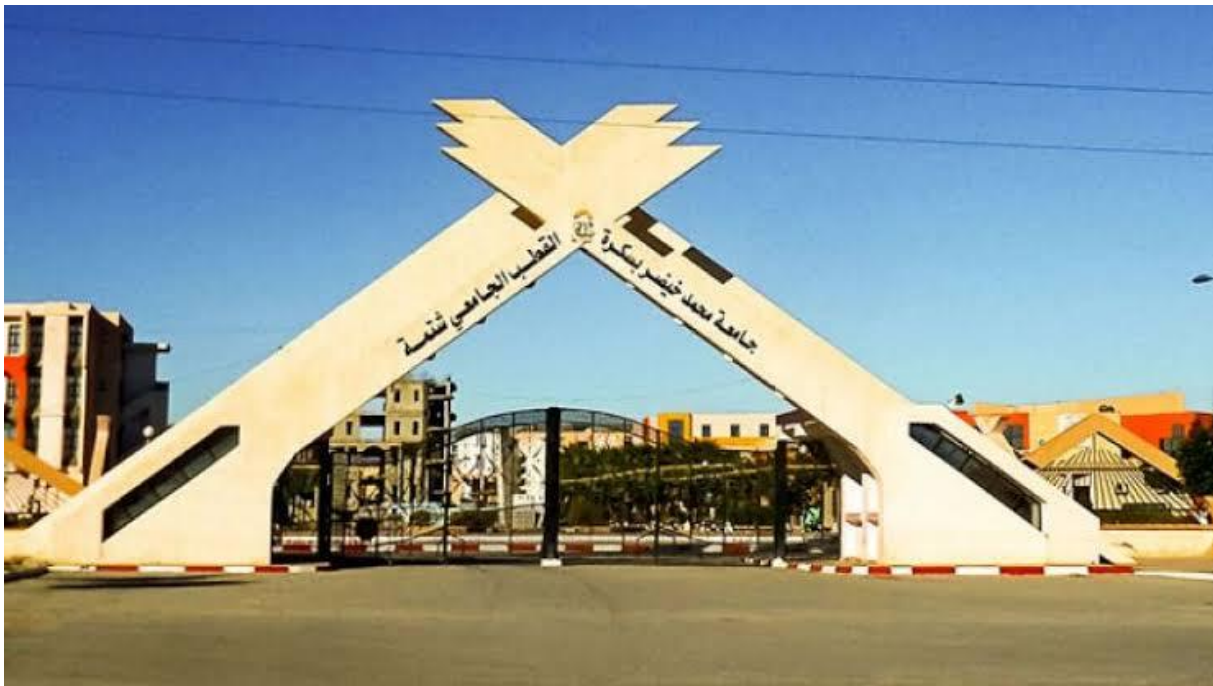
من تصوير الطالبتين : دلال ريس ، رقية برغيس