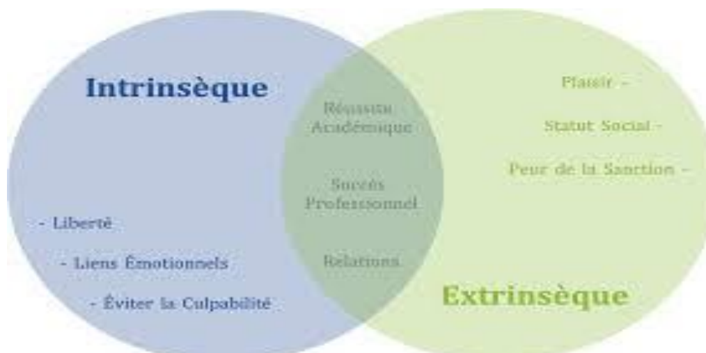
Schema de Différences entre motivation extrinsèque et motivation intrinsèque

Le schéma suivant résume les similitudes et les différences entre les deux types de motivations précédents extrinsèque et intrinsèque :