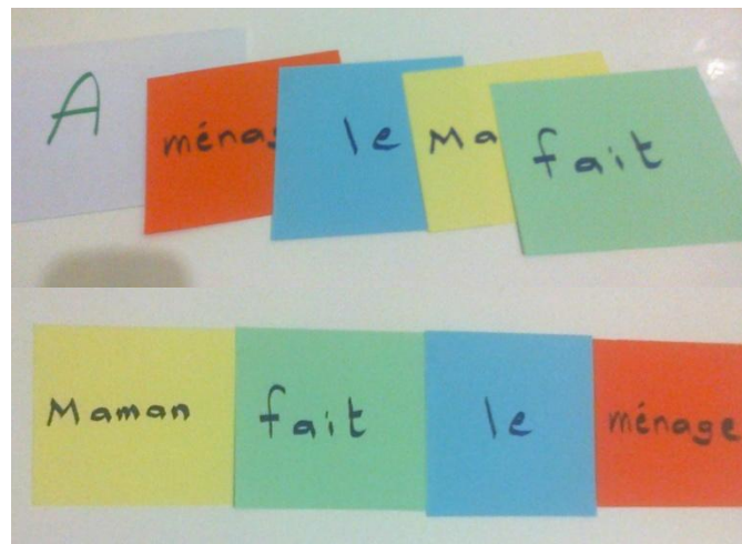
Figure : (2)

Nous avons distribué cinq enveloppes et chaque enveloppe contient quatre cartes de différentes couleurs, sur chaque carte s'écrit un mot, nous avons demandé aux apprenants de former une phrase à partir de ces cartes et les coller au tableau. Ensuite, chaque groupe lit à haute voix sa phrase et les autres groupes disent si elle est correcte. Donc c'est une forme auto-évaluation. L'auto-évaluation permet les apprenants d'évaluer leur progrès (maîtrise de soi, raisonnement, exploitation des notions apprises...).