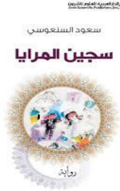
صورة 07 غلاف رواية سجين المرايا الصادرة عن دار العربية للعلوم بتاريخ 2011 في طبعتها الأولى