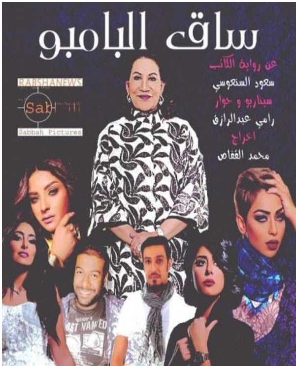
صورة 10 بوستر مسلسل ساق البامبو