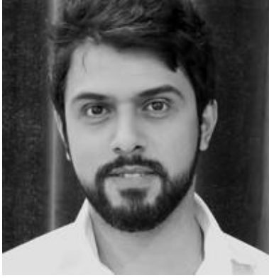
سعود السنعوسي الصورة 02

سعود السنعوسي من «مواليد 1981 كاتب وروائي كويتي عضو رابطة الأدباء في الكويت وجمعية الصحفيين الكويتيين. فاز عام 2013 بالجائزة العالمية للرواية العربية في دورتها السادسة عن روايته ساق البامبو التي حصلت جائزة الدولة التشجيعية في دولة الكويت عام 2012» 1 .