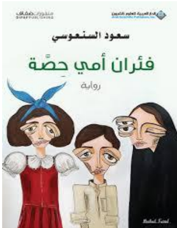
صورة 09 غلاف رواية فئران أمي حصة الصادرة في طبعتها الأولى عن دار العربية للعلوم بتاريخ 2015