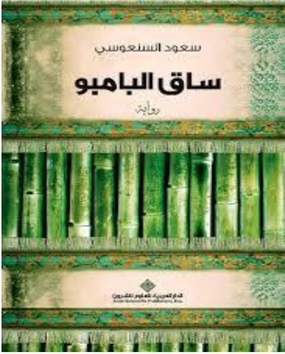
صورة 08 غلاف رواية ساق البامبو الصادرة في طبعتها الأولى عن دار العربية للعلوم بتاريخ 2012